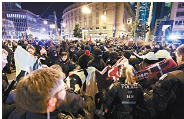
◆有組織發動反極右示威,抗議投票結果。

5%門檻。分析家認為,選舉結果可能導致執政聯盟出現更大分歧。自由民主黨地區支部負責人克默里奇表示,如果有必要,該黨可能離開執政聯盟。保守立場的基民盟議員斯潘認為,執政聯盟所有政黨同時遭選民放棄,是非常罕見的情況。