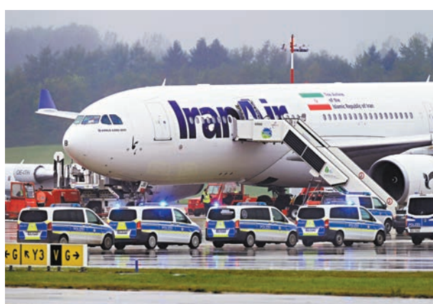
◆客機降落後,警員隨即登上飛機檢查所有乘客和機上行李。