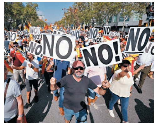
◆示威者批評桑切斯以特赦手段爭取政黨支持,削弱國家司法制度。

工人社會黨與人民黨在7月大選中均未能取得足夠議席單獨執政,要成功籌組新政府必須爭取其他政黨支持。