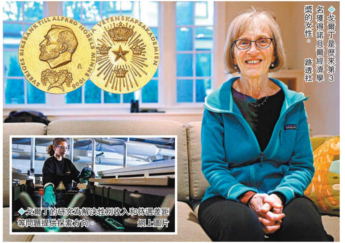
◆戈爾丁是歷來第3名獲得諾貝爾經濟學獎的女性。

戈爾丁是歷來第3名獲得諾貝爾經濟學獎的女性。評獎委員會強調,「得益於戈爾丁的開創性研究,我們對影響收入性別差異的潛在因素,以及未來或需解決的勞動力市場性別障礙,都有了更深入的理解。」戈爾丁將獨享1,100萬瑞典克朗(約781萬港元)獎金。