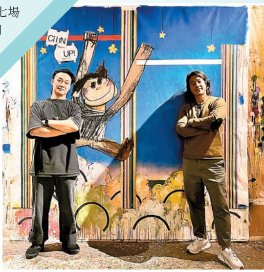
▶Eason 搵香港著名藝術家 Michael Lau 設計專輯封面。