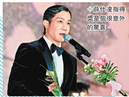
◆薛仕凌指得 獎是個很意外 的驚喜。

10月8日，2023年內地懸疑劇《漫長的季節》導演辛爽憑此劇，獲釜山影展第五屆「亞洲內容大獎&全球串流作品獎」最佳導演獎，主演范偉、李庚希等與導演共同亮相紅毯。該劇故事發生於上世紀九十年代的東北小城「樺林」，講述的司機王響(范偉 飾)與妹夫龔彪(秦昊 飾)偶然發現18年前的碎屍懸案，於是他們決定查明真相，並與偵辦過此案的退休警官馬德勝(陳明昊 飾)踏上了一場人生救贖之旅。導演辛爽在領獎時感謝了此劇台前幕後的工作人員，又說：「我們把火車從遙遠的樺林開到了美麗的釜山。」