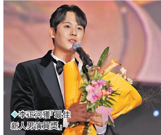
◆李正河獲「最佳 新人男演員獎」。

香港文匯報訊(實習記者 趙雨竹)第28屆釜山影展已於10月4日正式開始。各影視作品與主創團隊也都期盼着拿到令人矚目的獎項。釜山亞洲內容大獎是亞洲地區最具影響力的獎項之一，每年吸引來自亞洲各國及地區的頂尖影視作品競爭。該獎項旨在表彰並鼓勵亞洲電視劇的優秀表現。大熱韓劇《MOVING 超異能族》連斬6獎，內地導演辛爽憑藉懸疑劇《漫長的季節》榮獲最佳導演。