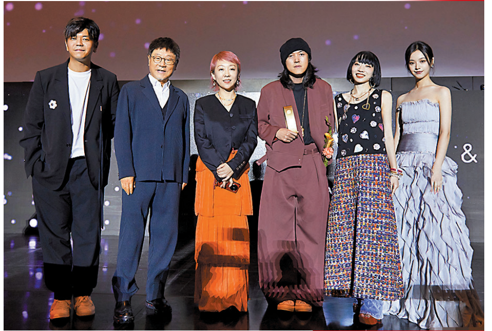
◆內地導演辛爽(右三) 攜《漫長的季節》主 創亮相釜山影 展。

香港文匯報訊(實習記者 趙雨竹)第28屆釜山影展已於10月4日正式開始。各影視作品與主創團隊也都期盼着拿到令人矚目的獎項。釜山亞洲內容大獎是亞洲地區最具影響力的獎項之一，每年吸引來自亞洲各國及地區的頂尖影視作品競爭。該獎項旨在表彰並鼓勵亞洲電視劇的優秀表現。大熱韓劇《MOVING 超異能族》連斬6獎，內地導演辛爽憑藉懸疑劇《漫長的季節》榮獲最佳導演。