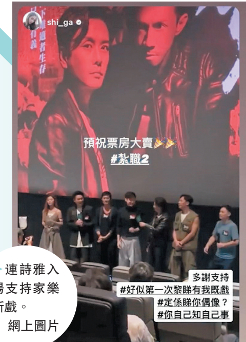
◆連詩雅入 場支持家樂 新戲。