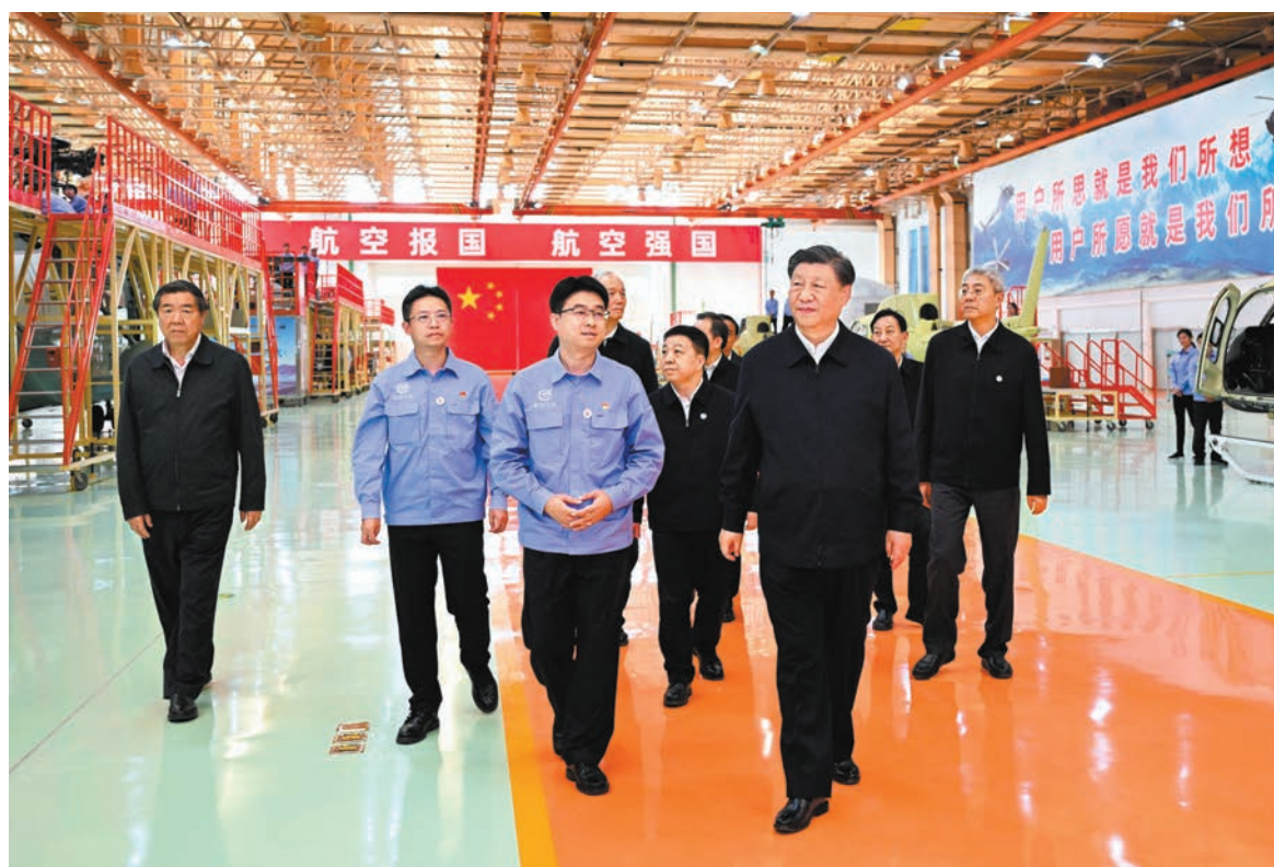
◆10月11日，習近平總書記來到昌河飛機工業（集團）有限公司，了解企業技術創新情況。這是習近平在昌河飛機工業（集團）有限公司考察。新華社