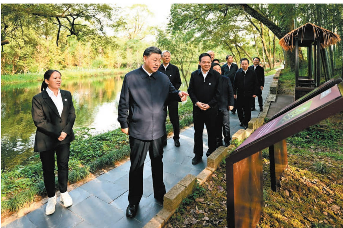
◆10月11日，習近平總書記來到上饒市婺源縣秋口鎮王村石門自然村，了解濕地公園生態保護、推進鄉村振興等情況。這是習近平在上饒市婺源縣秋口鎮王村石門自然村考察。