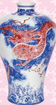
◆清雍正青花釉裏紅蒼龍教子圖梅瓶

這種成對的龍紋在唐英擔任督陶官的時期發展成熟，以《香港收藏大展》上的一支「清雍正青花釉裏紅蒼龍教子圖梅瓶」及今年5月在香港佳士得以1.08億港元成交的一支「清乾隆鬥彩蒼龍教子圖夔龍耳抱月瓶」為例，穿騰於祥雲之中的大龍正召喚在海水波濤中昂首應聲的小龍，整體氣勢壯闊恢宏，大龍蒼勁威猛，小龍纏繞相依，又體現了即便時李白筆下「最是無情帝王家」，亦有如尋常百姓家中「望子成龍」的普遍願望及深厚父愛。