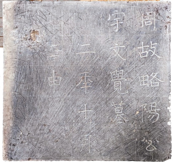
◆北周開國君主宇文覺墓誌石，正面楷書「周故略陽公宇文覺墓二年十月壬申」十五字。

作為中國歷史上南北朝時期北朝的最後一個朝代，公元577年北周攻滅北齊，結束了當時北方近半個世紀的分裂割據局面，也為隋朝日後統一全國奠定了堅實的基礎。此次發現的北周宇文覺墓葬，位於陝西咸陽市渭城區周陵街道北賀村，墓址所在地洪濱原，是北朝至隋唐時期高等級墓葬的集中分布地。該陵墓周邊亦分布了大量的北周皇族和貴族墓葬，東約1千米為宇文覺之父宇文泰第八子譙王宇文儉墓，東北約7.8千米為宇文覺同父異母弟、北周武帝宇文邕孝陵，西北約3.5千米為北周重臣豆盧恩家族墓地。