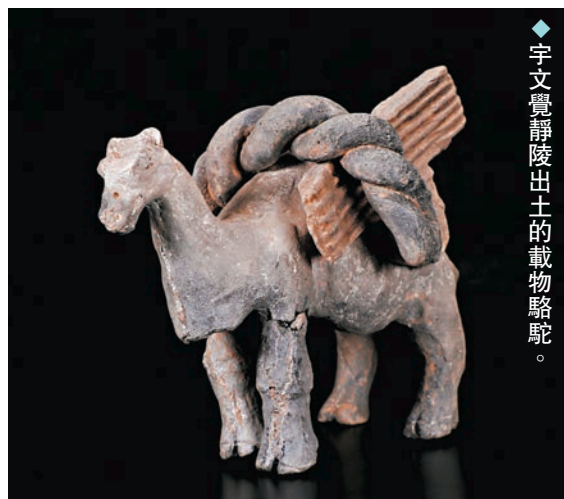
◆宇文覺靜陵出土的載物駱駝。