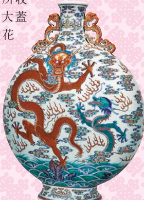
◆清乾隆鬥彩蒼龍教子圖夔龍耳抱月瓶