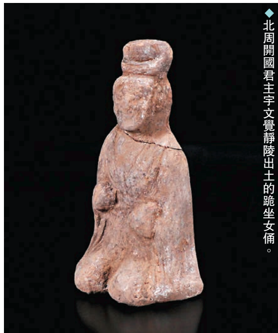
◆北周開國君主宇文覺靜陵出土的跪坐女俑。

周孝閔帝宇文覺（542年—557年），字陀羅尼，北朝西魏權臣宇文泰嫡長子，南北朝時代北周的開國君主，號稱天王。宇文覺生性剛毅果敢，對於其堂兄宇文護專政感到相當不滿。572年，北周武帝宇文邕誅殺宇文護，下令為宇文覺上諡號，於是派遣蜀國公尉遲迥在南郊上諡其為孝閔皇帝，稱其陵墓為靜陵。