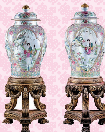
◆清雍正粉彩開光教子圖大蓋罐（一對）