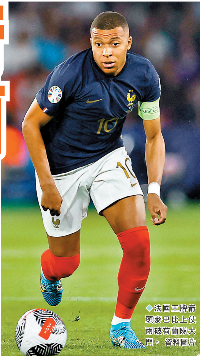
◆法國王牌箭頭麥巴比上仗兩破荷蘭隊大門。