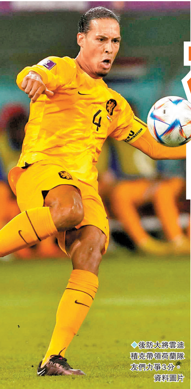
◆後防大將雲迪積克帶領荷蘭隊友們力爭3分。資料圖片