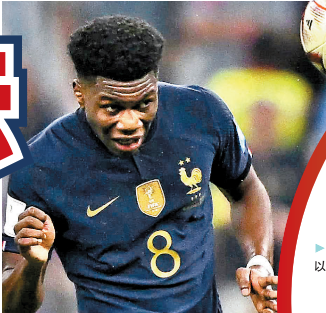
◆曹亞文尼已在法國中場線獨當一面。資料圖片

2024年歐洲國家盃外圍賽，將於香港時間14日凌晨爆發一場重頭大戰，由荷蘭隊回師主場，乘法國隊後防不整力爭全取3分，以保持小組出線的希望。近況狀態回勇的「橙衣軍團」，在自家球迷的打氣下，可望繼續發力在是役一報首循環大敗之仇。(UEFA.tv周六2:45a.m.直播) ◆香港文匯報記者 梁志達