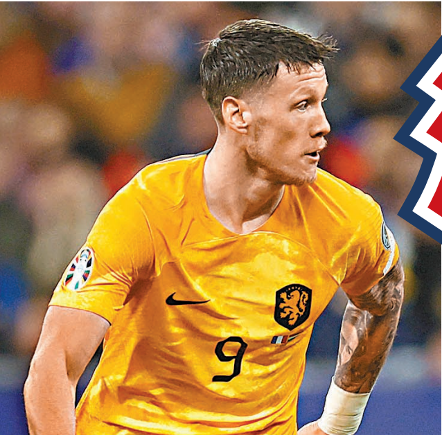
◆韋格賀斯是荷軍的高空轟炸攻擊點。資料圖片