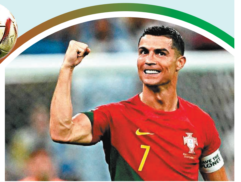
▶C朗拿度以老帶新。資料圖片

縱然首循環荷蘭隊曾慘吃法國4蛋，不過5年前歐洲國家聯賽「橙軍」也曾主場擊敗過法國隊，是役再次在自家球迷面前乘對手防線殘缺，荷蘭隊也未必沒有可重溫再挫法國舊夢的可能。