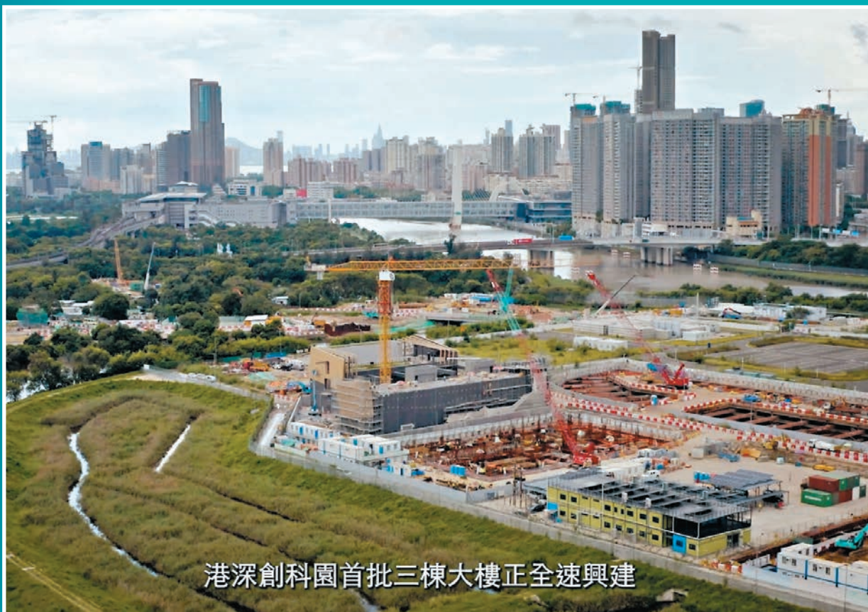
港深創科園首批三棟大樓正全速興建