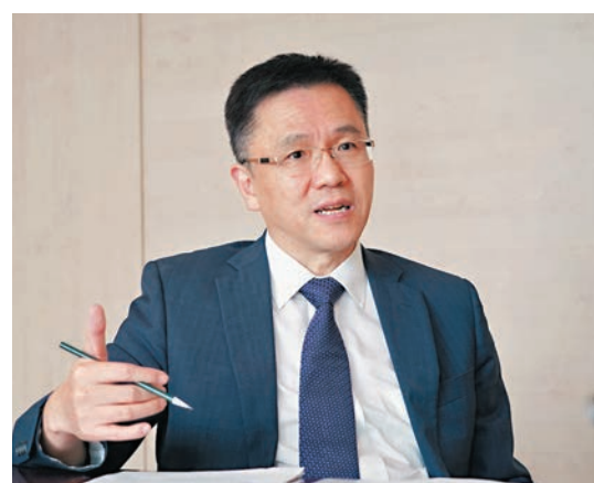
◆香港特區政府投放100億元的「產學研1+計劃」本月中推出，孫東形容，大學科研人員對計劃反應「異常熱烈」，多所大學都收到四五十份計劃書。

他說，加上即將啟動的「產學研1+計劃」孵化出來的初創企業、招商引資到來的重點企業，相信為數不少都會對河套、新田濃厚興趣，還有