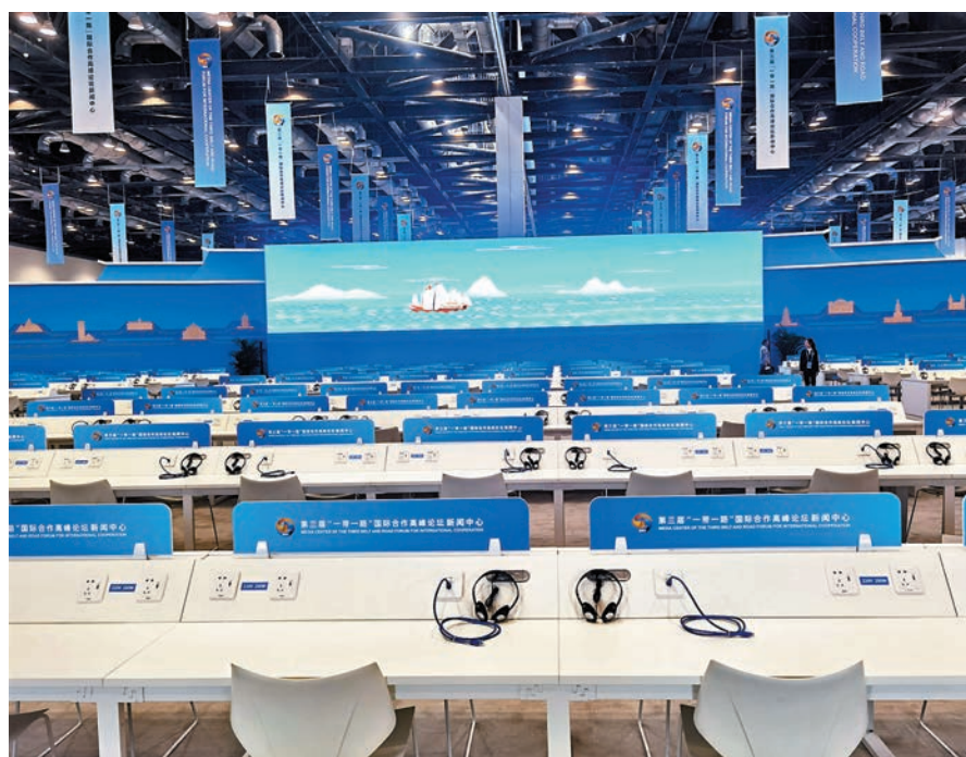
◆第三屆「一帶一路」國際合作高峰論壇新聞中心媒體工作台上，都配置同傳耳機，可以為記者提供24種不同語言的同傳服務。香港文匯報記者朱燁 攝

更讓香港文匯報記者感到有趣的是人工智能繪畫，現場有兩種體驗可選，第一種是畫一幅簡單的山水圖，系統會隨機為你匹配不同風格的作品。「像開盲盒一樣，我們有王希孟的《千里江山圖》，也有一些近現代作品，可以多畫幾次，看能不能集齊所有圖畫。」工作人員對香港文匯報記者說。第二種體驗即只需要拍攝一張正臉照片，等待一兩秒鐘，便能生成一段AI換臉視頻。香港文匯報記者點選漢服後，立刻穿越到天壇，成為一名身着紅色漢服，可飛簷走壁的俠女。而點選現代簡約風後，則又變成一個走在老北京胡同裏的現代少女，俏皮又酷。以上圖片或視頻均可通過掃描二維碼的方式保存在手機上，十分方便。