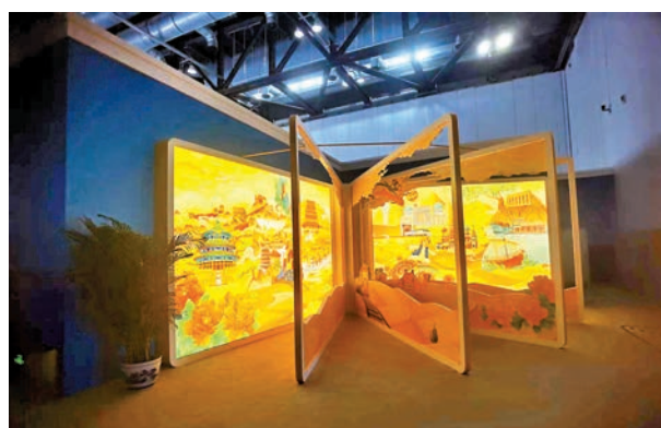
◆代表「絲綢之路經濟帶」的「書畫」景觀。