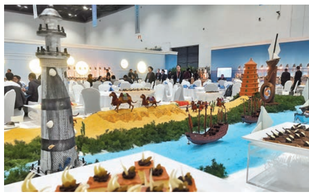
◆餐飲區冷餐檯上的「一帶一路」元素。