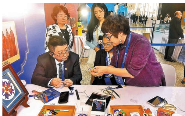
◆京式旗袍製作技藝體驗區。