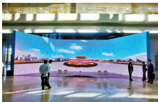
◆8K超高清半環繞三摺式大屏前，可完成飛躍北京標誌性場景的體驗。