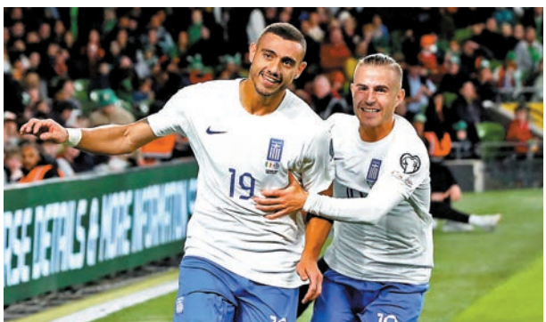
◆希臘隊近況不俗兼有地利。

剛主場不敵法國隊的荷蘭隊，目前以3勝2負排B組第3位，如果今晚未能一舉擊敗爭出線主要競爭對手，對爭取晉級十分吃虧。然而，荷蘭隊目前傷兵滿營，前中