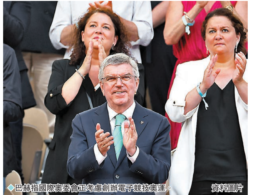
◆巴赫指國際奧委會正考慮創辦電子競技奧運。

上月初，巴赫宣布了2023年國際奧委會委員會的成員名單，並宣布成立了新的電子競技委員會，由國際奧委會委員戴維拉帕蒂擔任主席，他此前曾領導過國際奧委會電子競技聯絡小組。巴赫表示，國際奧委會認為虛擬體育運動可作為傳統奧林匹克運動的補充和增強，它們可以為運動員和粉絲們提供參與奧林匹克運動的新機會。