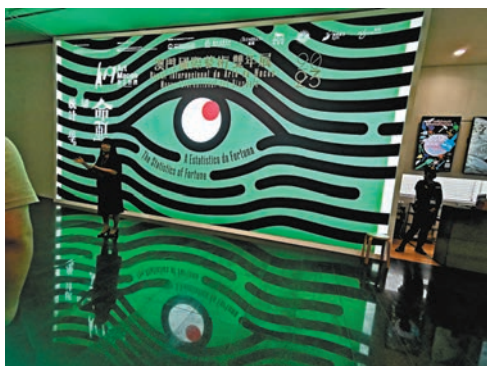
◆「命運的統計學」展覽海報