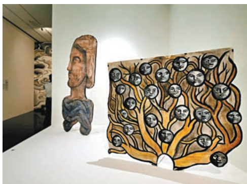
◆巴布洛·赫爾奎拉《利瑪竇的記憶宮殿》表演道具