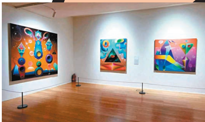
◆亞歷山德羅·基岡的布面油畫

葡萄牙藝術家卡塔麗娜·米爾-霍曼斯則帶來一個由玻璃及鋼絲組成的裝置，名為《我們也是幽靈》。垂直的鋼絲「用力」攀在牆上，支撐着30塊疊放的青綠色玻璃，整個裝置猶如層層翻湧的湖水，有些部分呈淺綠色，有些則呈深綠色，路過的人們可從中看到自己破碎的倒影。站在裝置側面看周圍的牆面與地面時，人們或許會產生「空間錯位」的奇幻錯覺。而當人們站在遠處望着這一牆漸變色的玻璃時，它們又成