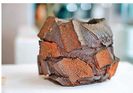
◆孫波作品《古老的存在》