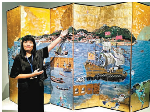
◆導覽員介紹君士坦丁《南灣I》屏風。