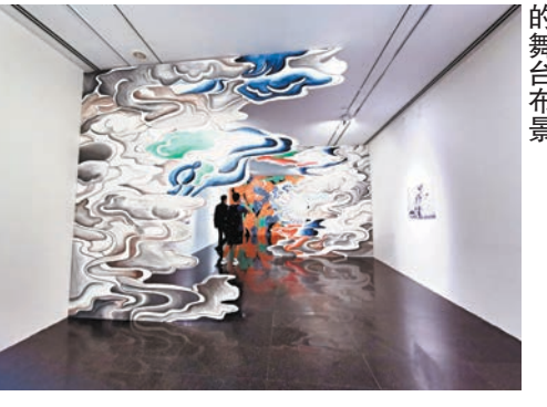
◆黃漢明設計的中國科幻戲曲的舞台布景