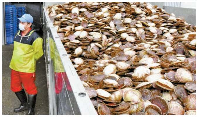
◆料日水產業將受到進一步打擊。圖為北海道扇貝。網上圖片

中國外交部發言人汪文斌早前表示，對日本政府強行啟動向海洋排放核污水這種自私自利、極不負責任的行徑，國際社會普遍給予批評並採取相關防範措施。中方主管部門依據中國法律法規以及世貿組織《實施衛生與植物衛生措施協定》相關規定，對原產地為日本的水產品採取緊急措施，完全正當、合理、必要。日方應立即停止核污水排海，以負責任的方式回應國際社會關切。