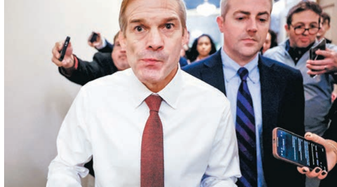
◆喬丹(左)或從極右非主流躍居至美國第三把交椅。

《紐約時報》指出，若59歲的喬丹能當選眾院議長，他將一舉從黨內極右翼的非主流，躍居至美國的第三把交椅。