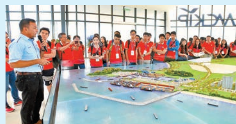
◆大馬關丹產業園的建設產生巨大溢出效應。

與中國之間的經濟聯繫發揮顯著作用，也為雙方在各領域更廣泛的合作鋪平道路。今後中馬兩國貿易投資合作可按照「兩國雙園」的合作模式，深耕數字化自動化、芯片技術、航空製造、綠色與可持續發展、高端教育與技能培訓等新興領域，為優化中馬投資貿易結構和深化雙邊經貿關係發揮更大作用。