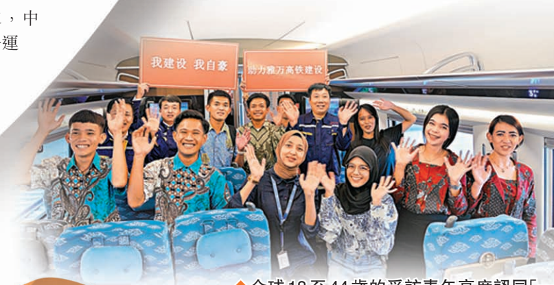
◆全球18至44歲的受訪青年高度認同「一帶一路」倡議的核心理念。

「一帶一路」倡議提出10年來，中國—埃及全面戰略夥伴關係高水運行，務實合作成果豐碩。埃及駐華大使哈奈菲認為，「一帶一路」倡議非常偉大，它「為二十一世紀的中國以及各國發展提供了未來願景」。