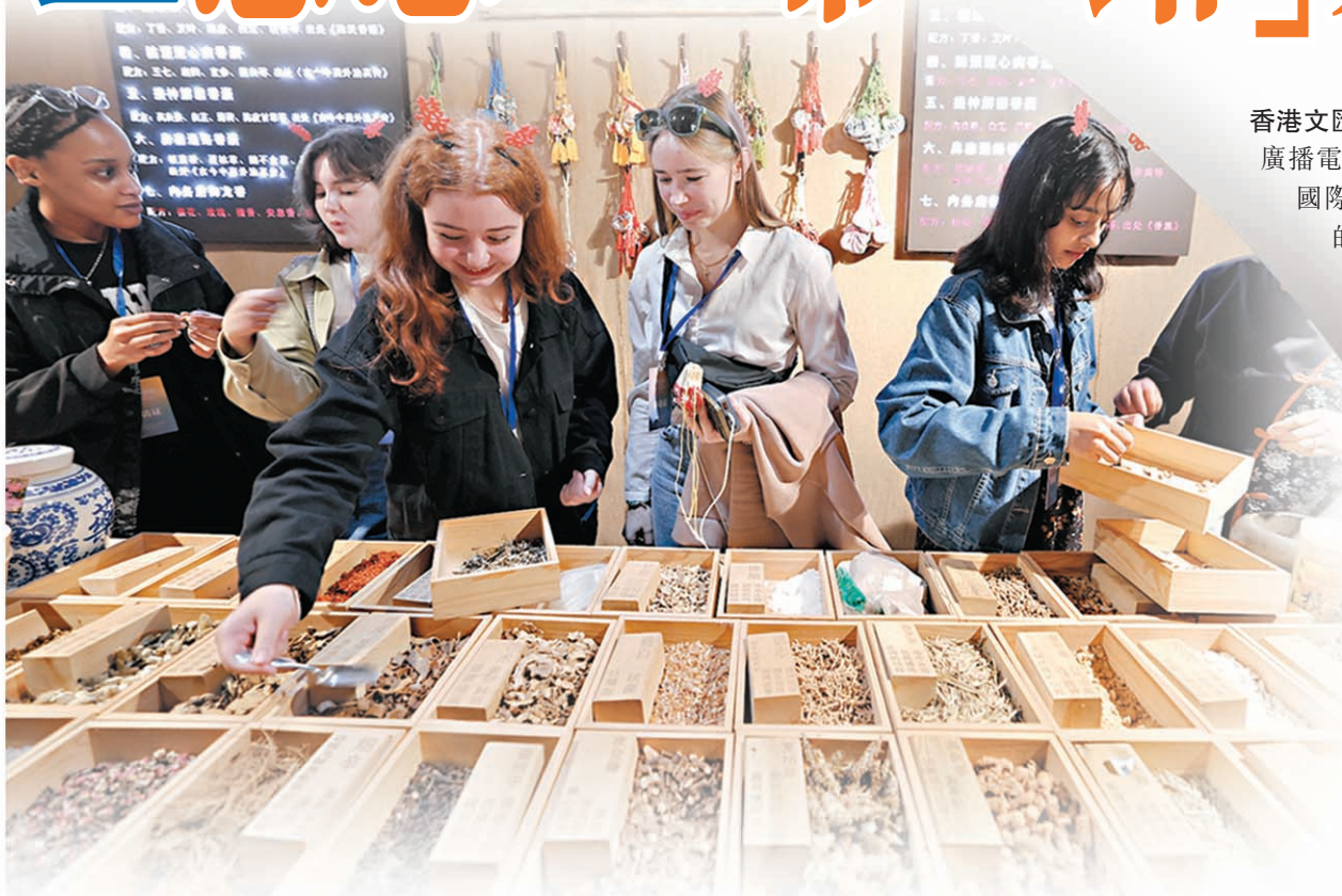
化生體驗中國鄉村文化