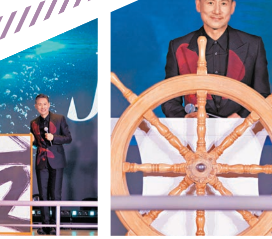
◆張學友巡迴演唱會香港站正式啟航。