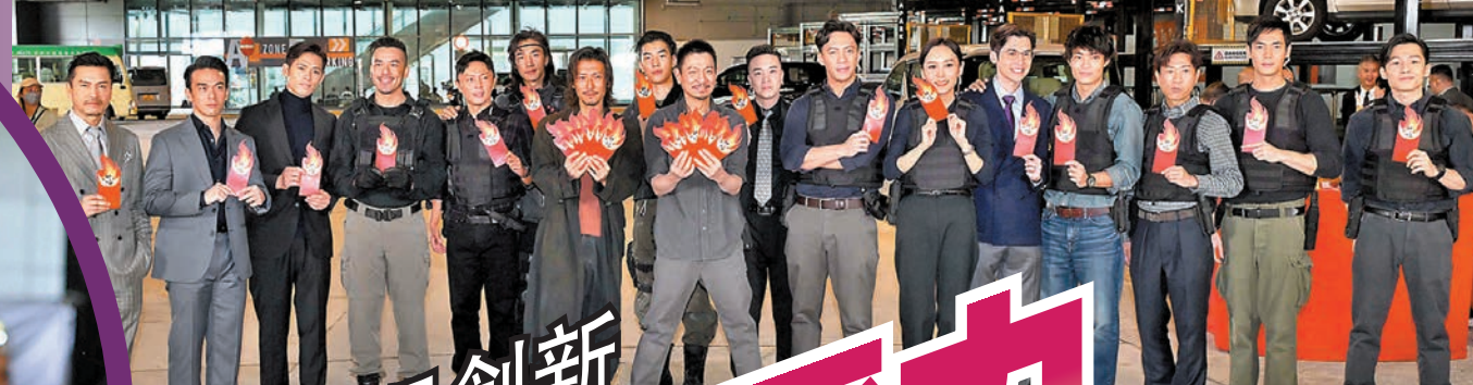
◆華仔與霆鋒向演員大派開工利是，祈求拍攝順利。