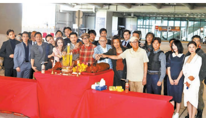
◆一眾主創齊切燒豬。