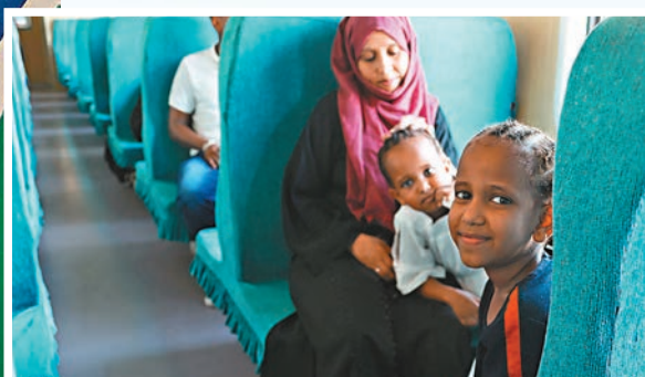
▲連接埃塞俄比亞和吉布提的亞吉鐵路是非洲第一條跨國電氣化鐵路。圖為乘坐客運列車的乘客。