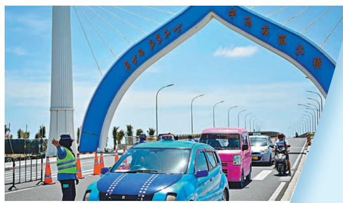
◆中馬友誼大橋將印度洋上隔海相望的島嶼相連，結束了兩地只能渡輪往來的歷史。

不僅如此，十年來，共建「一帶一路」以「六廊六路多國多港」為基本架構，形成「陸海天網」四位一體的互聯互通格局，托舉起共建國家繁榮發展的夢想，也為全球經濟注入新活力：亞吉鐵路讓東非實現跨國電氣化鐵路「零的突破」；雅萬高鐵跑出東南亞「最快速度」，累計為當地帶來5.1萬人次就業；中馬友誼大橋將印度洋上隔海相望的島嶼相連，結束了兩地只能渡輪往來的歷史；毛里塔尼亞友誼港擴建項目，顯著提高了港口吞吐能力；幫助巴基斯坦、尼泊爾、馬爾代夫等國實施機場升級擴建項目，給跨境流動和貿易往來帶來更多便利；中歐班列通達歐洲25個國家的200多個城市，為穩定國際產業鏈供應鏈作出了突出貢獻……世界銀行報告顯示，共建「一帶一路」實施以來，僅通過基礎設施建設，就使全球貿易成本降低1.8%，使參與國貿易增長2.8%到9.7%，全球貿易增長1.7%到6.2%，全球收入增加0.7%到2.9%。