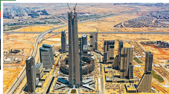
◆中資企業在埃及承建的385.8米「非洲第一高」標誌塔。圖為埃及及新行政首都中央商務區項目。資料圖片