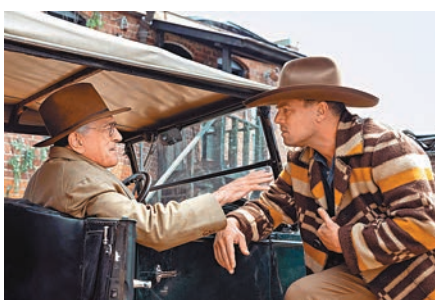
◆兩代影帝里安納度狄卡比奧與羅拔迪尼路在片中不斷鬥戲，勁呀！

電影改編自美國作家大衛格雷恩2017年的犯罪紀實暢銷書《花月殺手：美國連續謀殺案與FBI的崛起》，原著出版後，曾被《時代雜誌》、《華爾街日報》等主流報刊評為當年十大好書之一。《花月殺手》聚焦於上世紀二十年代的「歐塞奇印第安人謀殺案」，當年歐塞奇族人因原居地發現油礦而獲得持續巨額收入，有人為阻止上述安排而策劃連環謀殺，4年