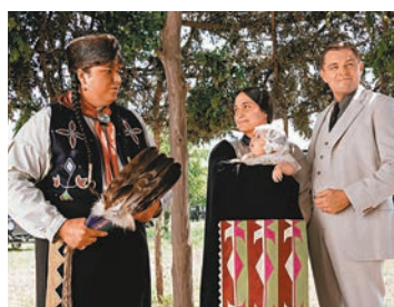
◆里安納度狄卡比奧與莉莉葛萊史東飾演夫婦。