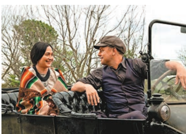
◆洛杉磯影評人協會最佳女配角莉莉葛萊史東。