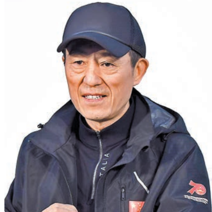
◆《堅如磐石》導演張藝謀。