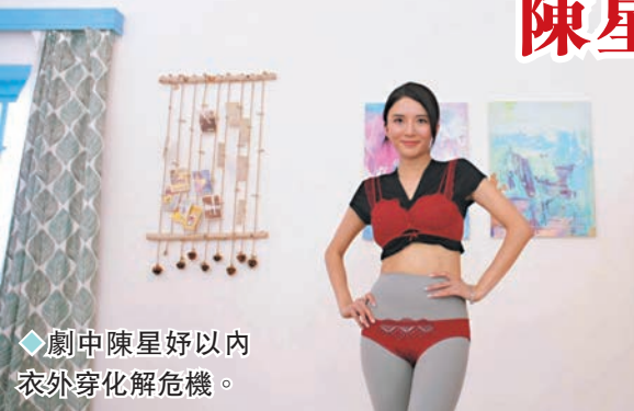
◆劇中陳星好以內衣外穿化解危機。