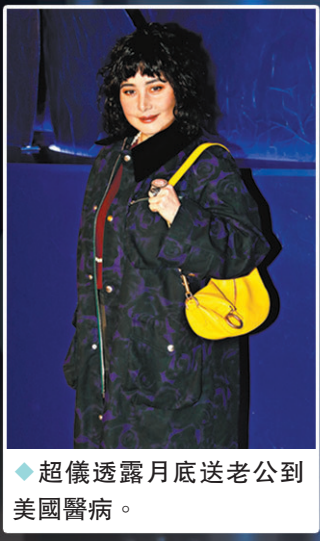
◆超儀透露月底送老公到美國醫病。

香港文匯報訊(記者阿祖)韓國女星全智賢、馮德倫、台灣金鐘獎最佳男主角吳慷仁、何超儀、周汶錡、徐濠縈、林恬兒、李靖筠及盧慧敏等昨晚出席時裝品牌活動。全智賢以壓軸嘉賓身份快閃亮相活動。