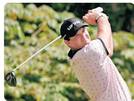
◆2018年美國大師賽冠軍列特落實參賽。

兩屆「香港高爾夫球公開賽」冠軍奧爾斯比、香港亞運金牌得主並於今年3月在主場贏得「國際都會高爾夫球錦標賽」後成為首位