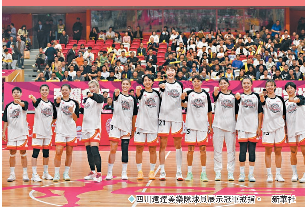
◆四川遠達美樂隊球員展示冠軍戒指。

2023至2024年賽季中國女子籃球聯賽(WCBA)日前拉開了新賽季戰幕。在揭幕戰中，擁有韓旭、李夢、王思雨等強將的衛冕冠軍四川遠達美樂女籃，在主場103:90戰勝浙江稠州銀行隊，迎來「開門紅」。