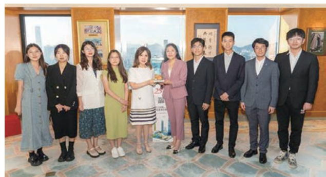
◆北京大學代表團到訪新鴻基地產香港總部。

新鴻基地產郭氏基金一直本着「育才樹人，科教興國」的宗旨，致力為國家培育人才，與多家大學建立助學合作關係。隨着疫情過去，基金與受助大學加強交流，內地大學派代表團到訪新鴻基地產的香港總部，新地郭氏基金亦先後到訪內地多所大學，包括北京大學、同濟大學及復旦大學，就助學事宜交流討論。據悉，基金成立至今已向29間高等院校提供資助，受惠畢業生人數超過11000人。