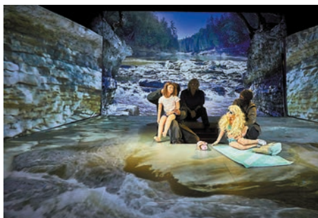
◆《庫維爾 1975：青春浪潮》