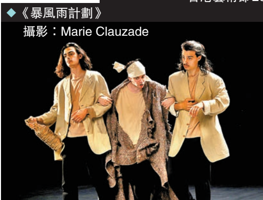
◆《暴風雨計劃》

香港藝術節2024 更多節目詳情： www.hk.artsfestival.org