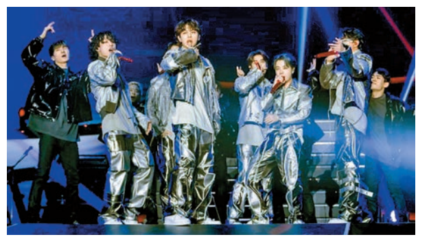
◆iKON今年5月開展世界巡迴演唱會。 《hercules》均大受歡迎。至於另一位成員具俊會最近就參加韓劇《閃亮的西瓜》演出,飾演劇中樂隊的主唱,並負責了該劇的原聲帶《Higher》。

其實iKON在過去幾年中推出了多首熱門歌曲,包括《Love Scenario》、《Killing Me》和《My Type》等,近年iKON的成員們發展更是多才多藝,好像BOBBY先前就推出了新專輯,當中的新歌《F》和