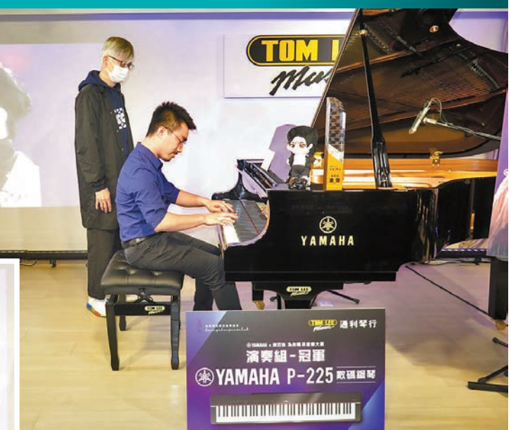
▲演奏組冠軍人馬獻技。