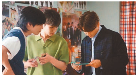
▲SHINee成員一起回望過去的15載。

香港文匯報訊 今年是韓國男團SHINee出道15周年,專屬紀念電影《My SHINee World》將於11月3日在香港與韓國同步上映,記錄與粉絲攜手同行的15載。《My SHINee World》門票於10月20日公開發售。