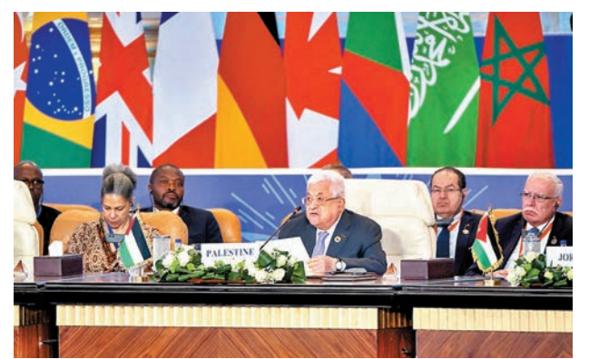
◆巴勒斯坦自治政府主席阿巴斯在開羅和平峰會上發言。

洲和阿拉伯國家等多國官員出席會議，包括古特雷斯、約旦國王阿卜杜拉二世、英國外相克萊弗利等。中國政府中東問題特使翟雋亦應邀與會，中國外交部指中方願同國際社會一道，為緩和當前緊張局勢、推動停火止戰、避免人道災難、恢復和談作出不懈努力。俄羅斯則由外交部副部長博格丹諾夫代表出席。