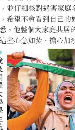
◆埃及開羅大學學生抗議美國援以。