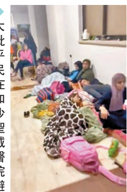
◆大批平民在加沙聖城醫院避難。網上圖片

(History Is Watching)，又指人道援助必須得以抵達加沙地帶。聯署這封公開信的名人還有美國著名喜劇演員莊司徒、奧斯卡影后蘇珊莎朗頓、美國女演員金塔布倫森、《拉米的瘋狂美國夢》主角優素福、英國男星艾哈邁德，以及曾奪奧斯卡最佳男配角的馬許沙拉艾利。