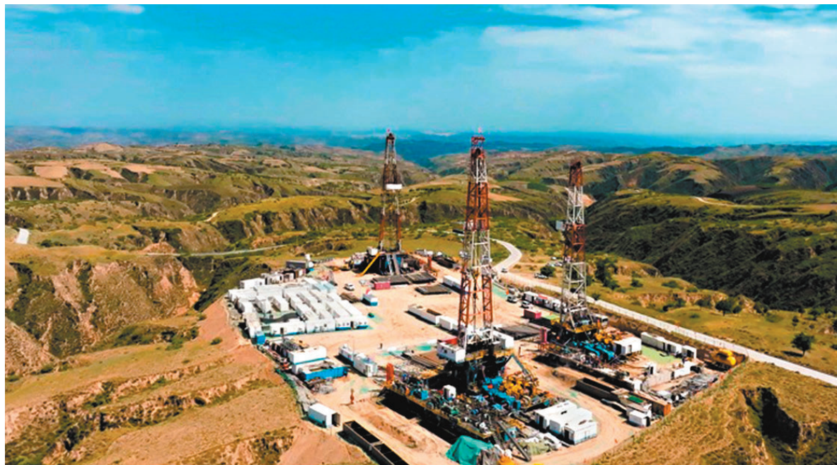
◆神府深煤層大氣田三鑽機同合作業。

我國煤層氣資源豐富，一直以來，煤層氣的勘探開發大多集中在埋深小於1,000米的煤層。由於缺乏配套的工藝技術，埋深超過1,500米的煤層長期以來