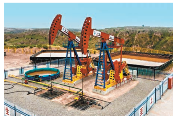
◆神府深煤層大氣田首口深煤層水平井排採現場。