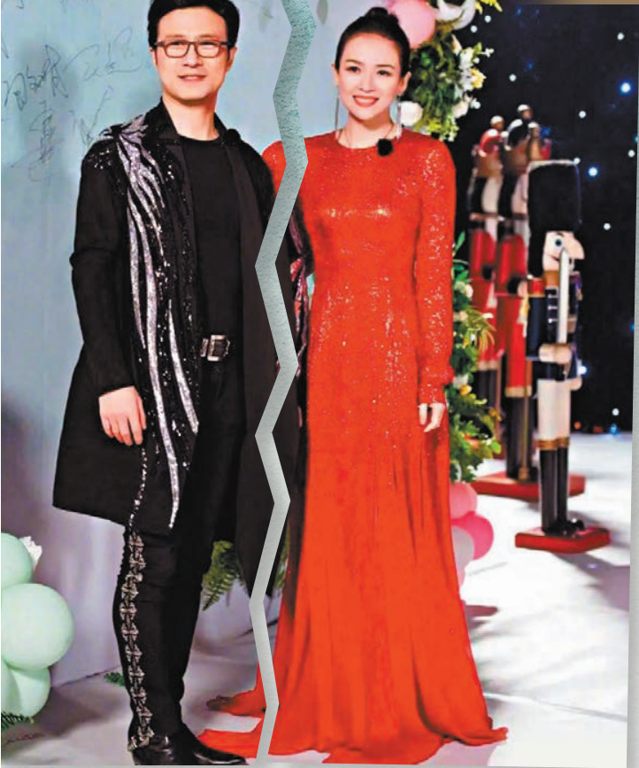
◆章子怡與汪峰8年情斷。