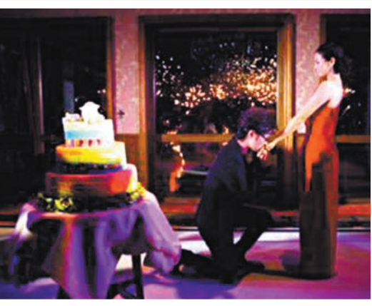
◆汪峰在章子怡生日派對上求婚。資料圖片

「親愛的朋友們：感謝大家一直以來對我和峰哥的關心與支持。經歷了八年婚姻的我們經過慎重考量與商議，決定解除婚姻關係，未來將以親人身份共同撫養、陪伴孩子們長大，依舊是孩子們最信任的父母。我們曾攜手共度