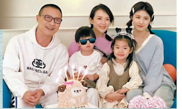
◆章子怡對繼女「小蘋果」視如己出，一家五口幸福美滿。

香港文匯報訊（記者 安夏）44歲國際影后章子怡與內地歌手汪峰結婚8年，先後誕下一子一女，惜婚姻一直不被外界看好，多年來屢傳婚變，雖然二人努力以行動粉碎謠言，但昨日（23日）12時內地狗仔（專搜索秘聞爆料記者）爆汪峰和章子怡已離婚，女兒歸汪峰，兒子歸章子怡。消息一出震驚全網，話題「章子怡汪峰離婚」更火速衝上热搜第一位。昨日（23日）下午4時許，章子怡、汪峰共同發布離婚聲明，宣布八年婚姻終結：「經歷了八年婚姻的我們經過慎重考量與商議，決定解除婚姻關係，未來將以親人身份共同撫養、陪伴孩子們長大。」