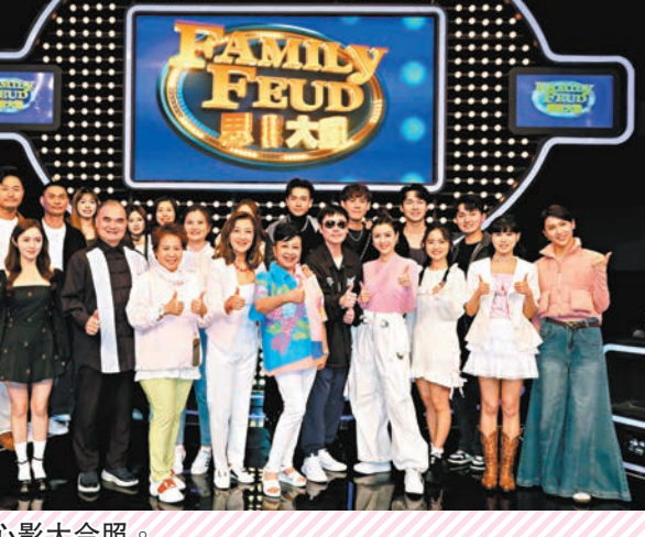
◆眾人開心影大合照。

香港文匯報訊（記者 梁靜儀）薛家燕、陳茵媺、周嘉洛、鄺潔楹及蔣祖曼等，前晚為TVB節目《思家大戰》第三季錄影，已第三次參加節目的家燕姐笑指不知道主持人李思捷為何對她念念不忘。