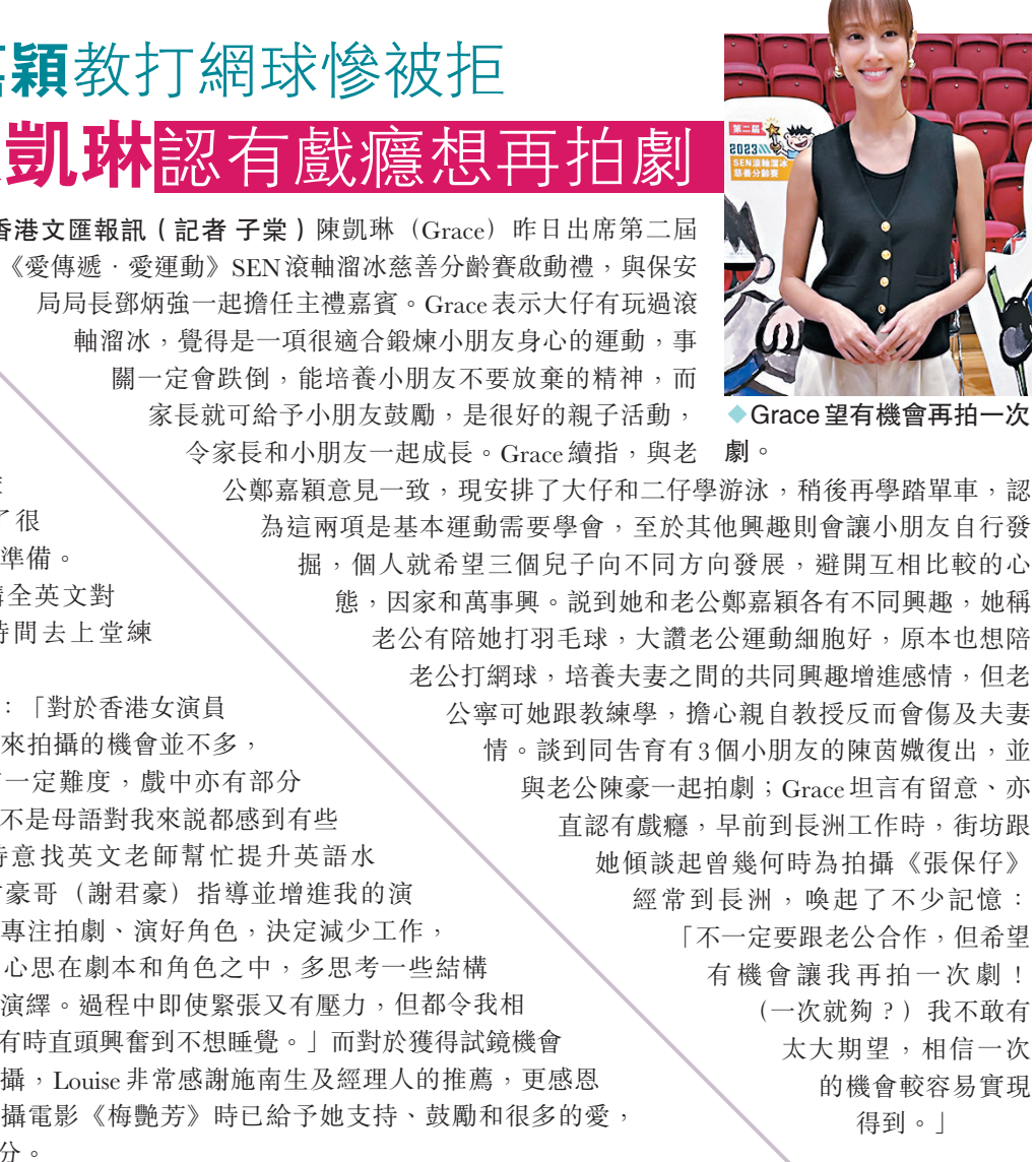
◆Grace望有機會再拍一次劇。