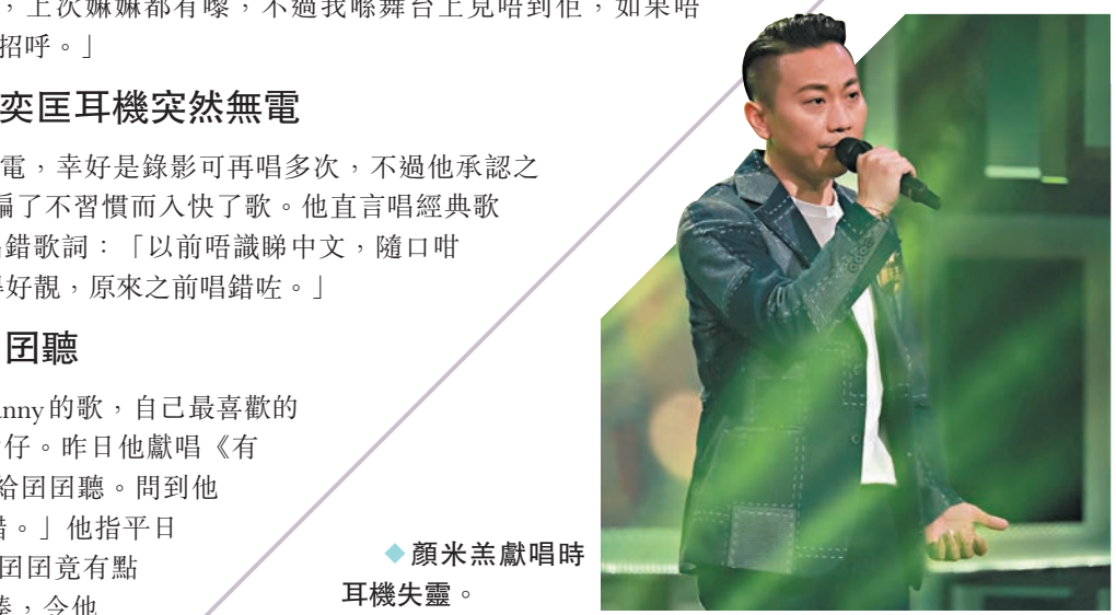
◆顏米羔獻唱時 耳機失靈。