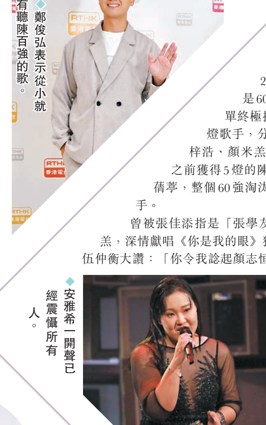
◆鄭俊弘表示從小就有聽陳百強的歌。