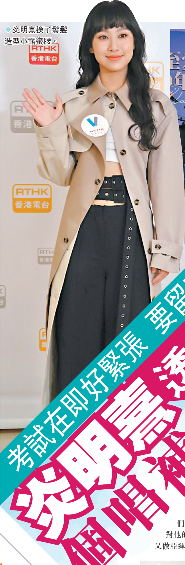
◆炎明熹換了髮型 造型小露蠻腰。 RTHK 香港電台