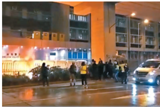
◆修例風波中旺角警署不時遭暴徒襲擊破壞。圖為2019年10月13日黑衣暴徒向警署投擲超過20枚汽油彈。

裁判官裁決時指，接納3名警員的證供，包括觀看閉路電視認被告、在場發出警告，及負責拘捕的警員。裁判官指3人為誠實可靠證人，合乎情理和邏輯，辯方亦沒有太大挑戰。當天旺角警署有逾百人集結並以鐳射筆不斷射向警方，而被告與在場其他人一同叫喊的口號具威嚇、侮辱和挑撥性，使用鐳射筆不但增加警方行