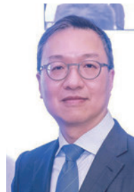
◆律政司司長林定國致辭。