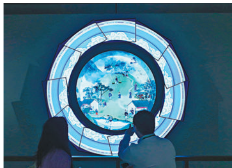
◆《橋中洞景》作品的外圍有拱橋和環形兩種形態，每15分鐘開合一次。