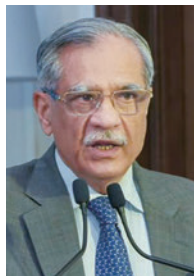
◆巴基斯坦前首席法官Chief Justice Nisar, Mian Saqib致辭。