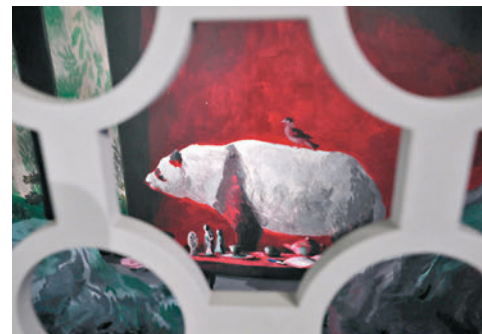
◆《庭院物想》藝術家採用香港公共屋邨常見通花窗，從窗花中窺景。

「山林市城」展覽設於香港故宮館展廳7，屬常設展覽之一，共展出7件跨領域多媒體作品，由8位本地藝術家（或藝術家組合）完成，作品旨在以當代視角演繹中國古典園林的精髓。