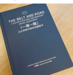
◆《協議範本》為「一帶一路」倡議提供了重要的支持。