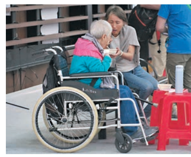
◆照顧者餵長者進餐。

他認為政府增加照顧者津貼是好事，惟照顧者津貼申請條件較苛刻，「如果申請了綜援，就不能申請照顧者津貼；申請了長者津貼，也不符合資格申請。全港有十幾萬的照顧者，而照顧者津貼只有一千多兩千名額，想要申請實在太難，希望政府在照顧者津貼申請上能夠放寬。」