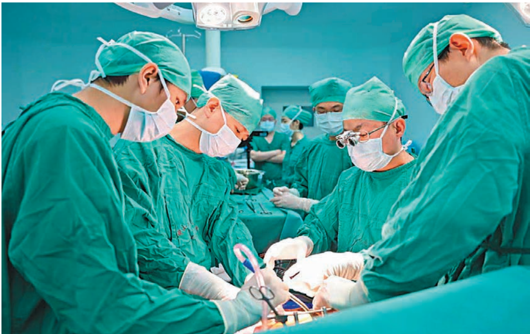
▲9月14日，一期手術灌注化療中。