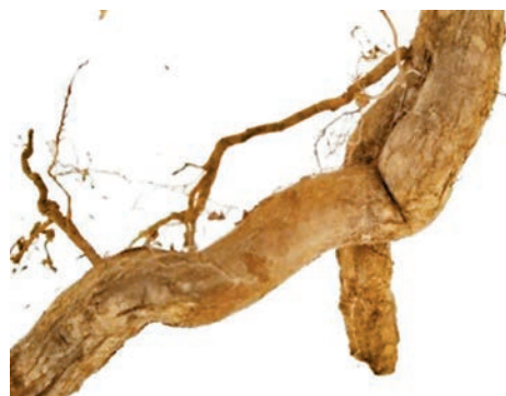
◆鈎吻的根表面呈灰棕色或棕色。