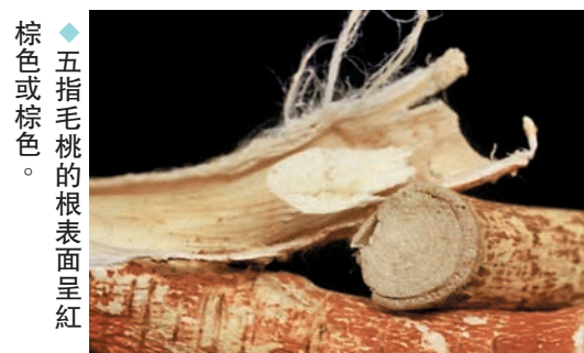
◆五指毛桃的根表面呈紅棕色或棕色。