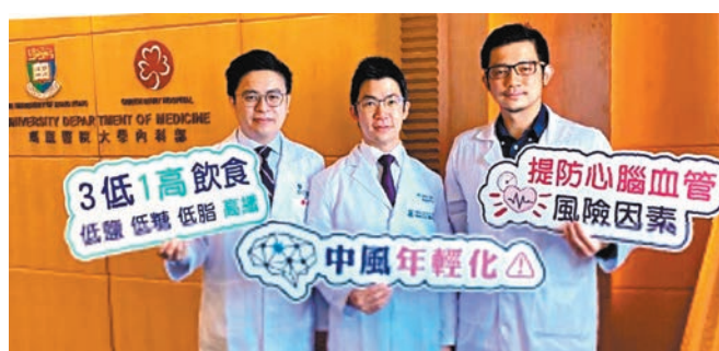
◆香港大學中風研究組團隊會到場與市民見面。

同時，展覽內會展示由香港大學機械電子工程系運動人工智能實驗室、香港大學中風研究組及香港復康會，