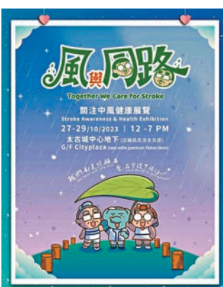
◆「風與同路」關注中風健康展覽。

以溫暖的筆觸繪畫17幅圖文作品，描寫中風患者和照顧者在復康路上的心路歷程。作品取材自真實故事，邀請參加者細心療癒插畫，感受「愛與堅強」的力量，為患者及照顧者打氣。