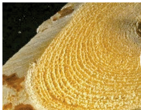
◆五指毛桃的根部橫切面有細密同心環。