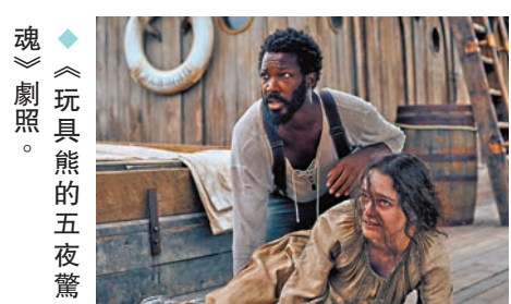
◆《玩具熊的五夜驚魂》劇照。