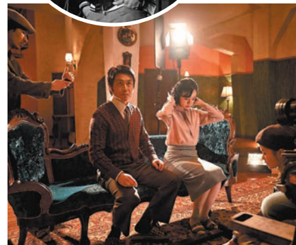
◆電影復刻上世紀七十年代韓國影壇的瘋狂逸事，以幽默的表達形式向電影人致敬。