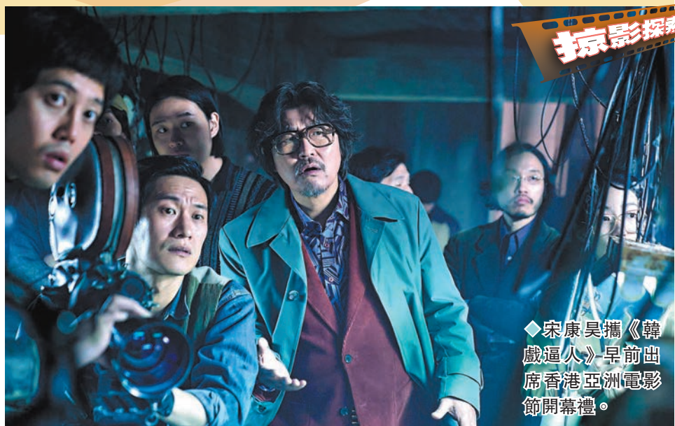
◆宋康昊攜《韓戲逼人》早前出席香港亞洲電影節開幕禮。

早前，康城影帝宋康昊攜新作《韓戲逼人》來港出席香港亞洲電影節開幕禮，跟香港影迷見面，並分享今次拍攝電影的心得，他說：「電影描繪的是上世紀七十年代電影人的奮鬥故事，但其實也恍如人生故事，我們也像戲中導演一樣，或會經歷低谷，最重要是泰然處之，積極面對。」對於戲中「金導演」一角，宋康昊表示：「因為只需要給其他人指示，演得好舒服又很有趣！」問他有否請教導演金知雲如何演好導演角色？他笑說：「導演的角色實在太有趣！因為太興奮，所以我就只是隨心所欲去演。」其實，宋康昊與導演金知雲私交25年，今次已經是兩人第5次合作，默契無間。