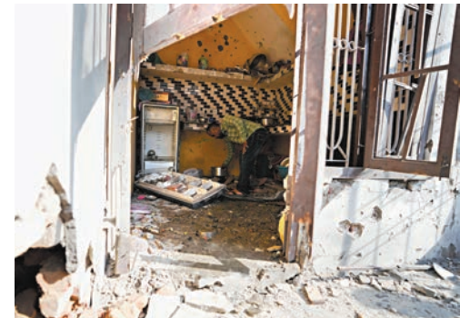
◆印度邊境民居損毀嚴重。

自1947年印巴分治後，印度和巴基斯坦曾為爭奪克什米爾地區多次爆發戰爭。2003年，兩國軍方在克什米爾印巴實際控制線一帶達成停火協議。2021年，雙方同意嚴格遵守克什米爾停火協議。近來，兩國軍隊在克什米爾實際控制線附近不時發生交火，並相互指責對方破壞停火協議。