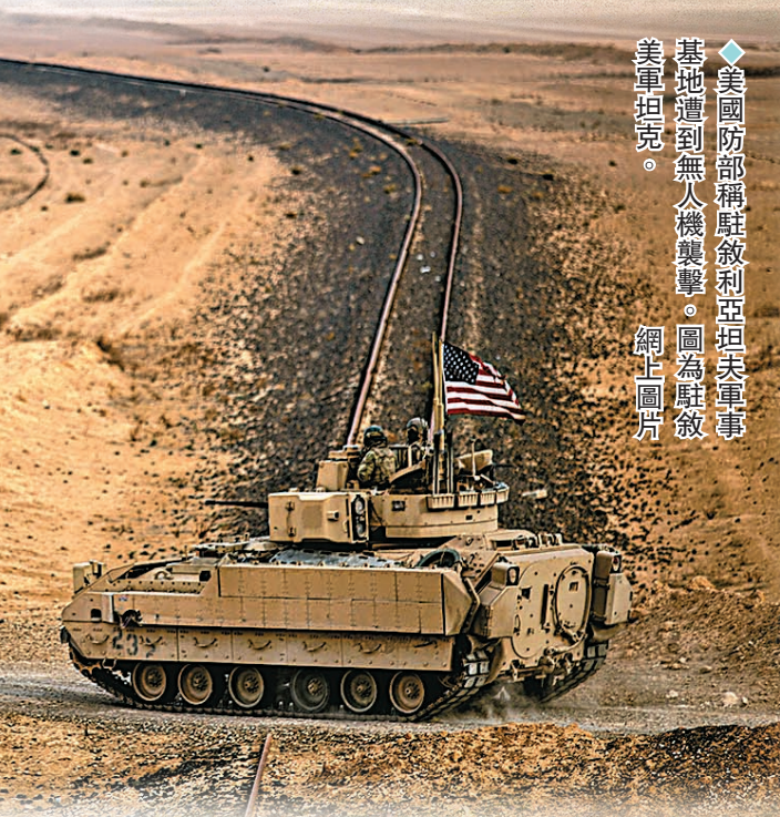
◆美國國防部稱駐敘利亞坦夫軍事基地遭到無人機襲擊。圖為駐敘美軍坦克。網上圖片