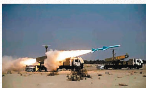
◆伊朗軍隊在伊斯法罕進行軍演。網上圖片

路透社引述伊朗軍方發言人切沙克表示,今次演習會測試包括200多架軍用直升機的飛行準備,強調演習早前已經規劃好,旨在「應對伊斯蘭共和國面臨的潛在威脅」,但未有詳細說明。伊朗並未披露參與演習的武器型號,俄羅斯塔斯社分析,伊朗伊斯蘭革命衛隊海軍今年8月在波斯灣舉行演習時,曾使用射程分別為120公里和300公里的「法塔赫」彈道導彈和「卡德爾」巡航導彈,以及無人艇和無人機等。