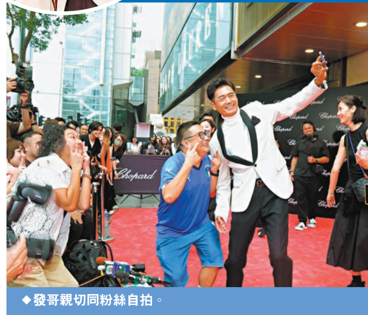
◆發哥親切同粉絲自拍。