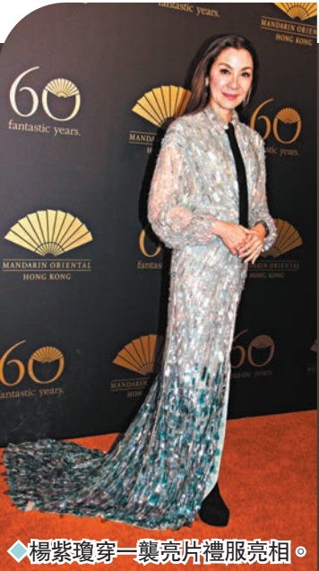
◆楊紫瓊穿一襲亮片禮服亮相。