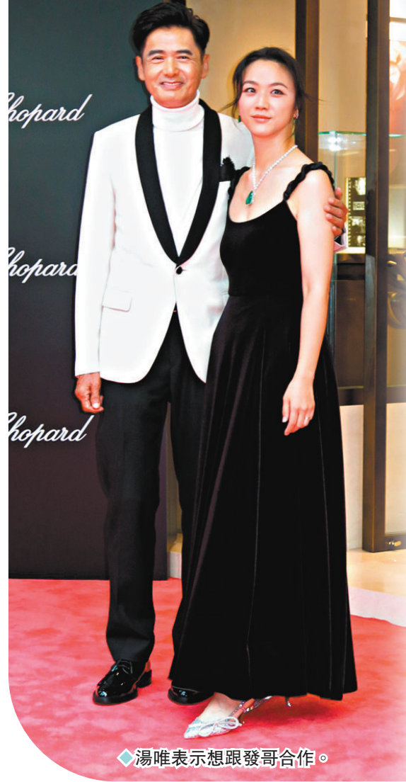
◆湯唯表示想跟發哥合作。

談到發哥之前在《第28屆釜山國際電影節》獲頒「亞洲電影人獎」，他坦言入行50年好難得，獲獎好開心，也要答謝觀眾們喜歡自己。問怎樣慶祝？他笑言已去了深水埗吃腸粉，他跟舖頭老闆及食客都很熟絡，吃完還自拍。發哥一直都有留意香港的影視圈發展，他坦言不介意與新演員合作，像TVB都有很多有潛質的新演員，只暫時未說得出其名字，覺得他們演技都不錯。