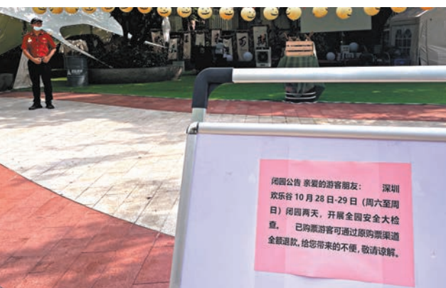
◆事故發生後,歡樂谷景區出通告周末閉園兩天,暫停營業。

另一位事故的傷者張先生回憶當時車是坐滿的,大部分遊客都是年輕人,甚至還有小朋友,但還好坐在前面座位,相對來說情況不會很嚴重。「正常的情况下,我們這一趟先過坡,彈射出去,然後快要回來的時候再把下一趟車放出去。但我們這一趟特別奇怪,我們都還沒到點,第二趟提前玩完回來準備進場下車,加上我們坐的車彈射力不夠沒有到頂點就原路滑回來了,然後撞上了。」