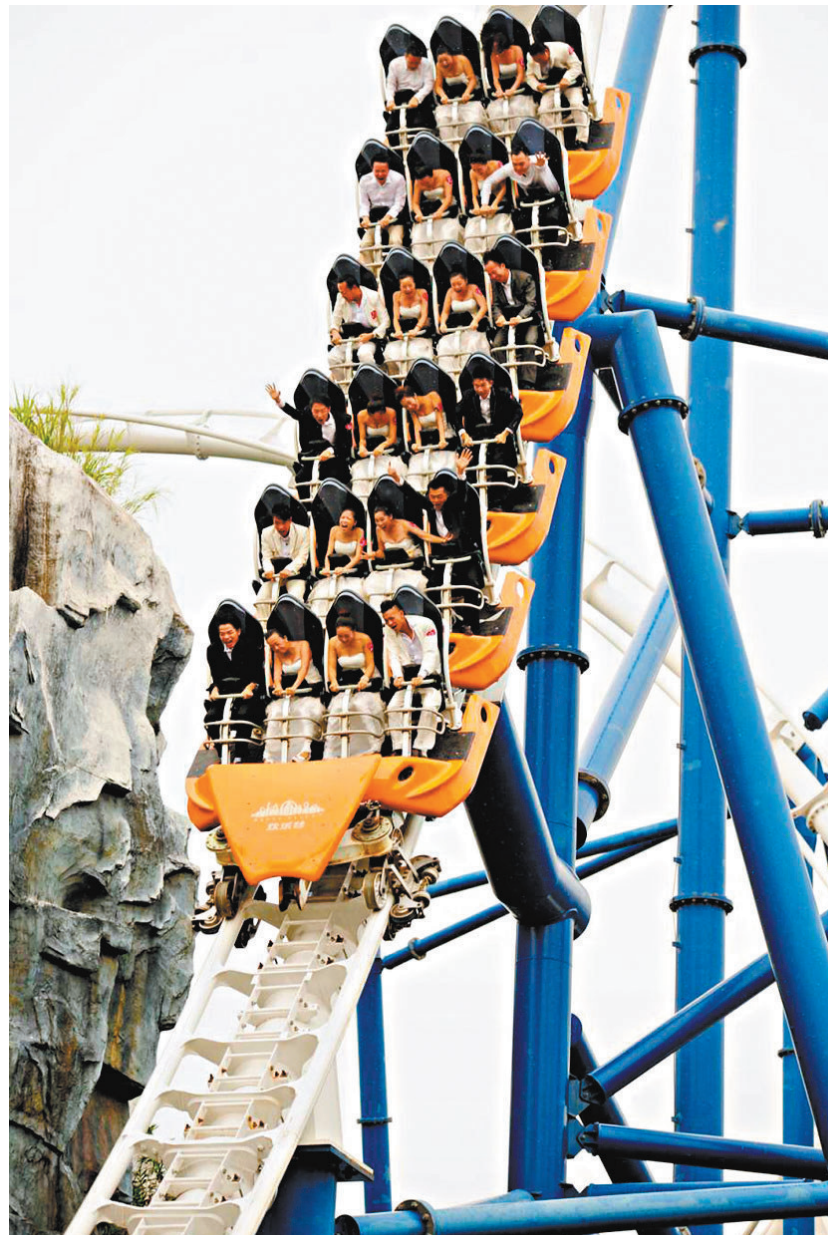
◆「雪域雄鷹」是深圳歡樂谷彈射式過山車類遊戲項目,耗資2億元人民幣打造,是目前全國最高、最長的彈射式過山車之一。資料圖片

深圳歡樂谷景區「雪域雄鷹」項目發生車輛碰撞事故後,多名受傷遊客被迅速送往香港大學深圳醫院、深圳華僑醫院以及南山區人民醫院進行緊急治療。港大深圳醫院相關人士接受香港文匯報記者查詢時答覆稱,目前就醫傷者情況平穩,均無生命危險。