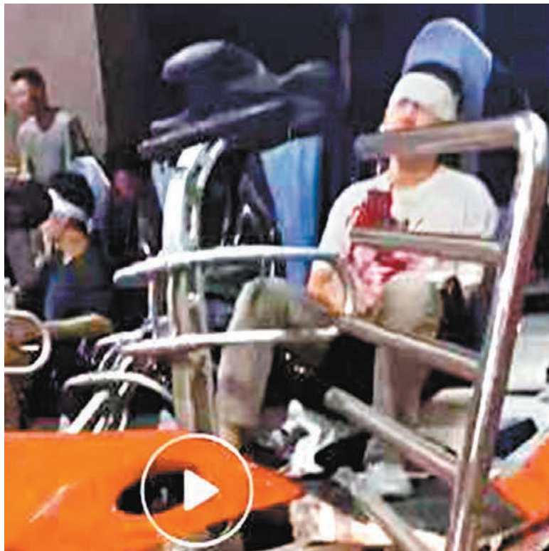
◆事故中傷者正等候救治。 視頻截圖

在10月27日晚,一張網傳圖片顯示,此次事故的多名傷者被送往港大深圳醫院,該醫院貼出公告稱,「因過山車追尾,現急診室有多人在搶救,現在掛號等待時間大約4小時以上。」醫院服務熱線接