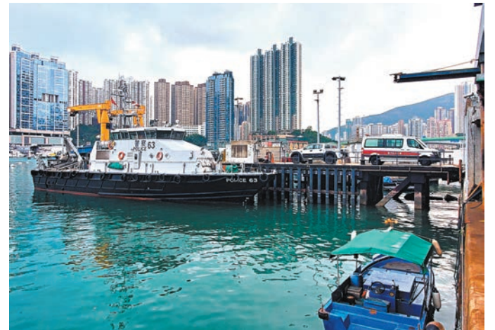
◆警方將蒲台島截獲的南亞商人蛇押返水警基地扣查。

香港文匯報訊(記者 蕭景源)警方繼前日在橫瀾島截獲28名孟加拉籍偷渡客後，昨日再獲獲蒲台島出現南亞商人蛇報告。警方派出水警、機動部隊等，在政府飛行服務隊直升機協助下登島搜索，截獲共28名南亞裔非法入境者。這是警方在一周內截獲的第五批南亞裔「人蛇」，累計人數已達90人。