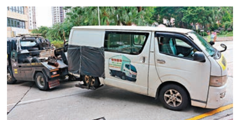
◆涉事客貨車被拖走作進一步檢驗。

多名司機在社交平台上載事發時的「車Cam」影片，不少網民更舉報車牌號碼，要求警方追緝。影片所見，涉事