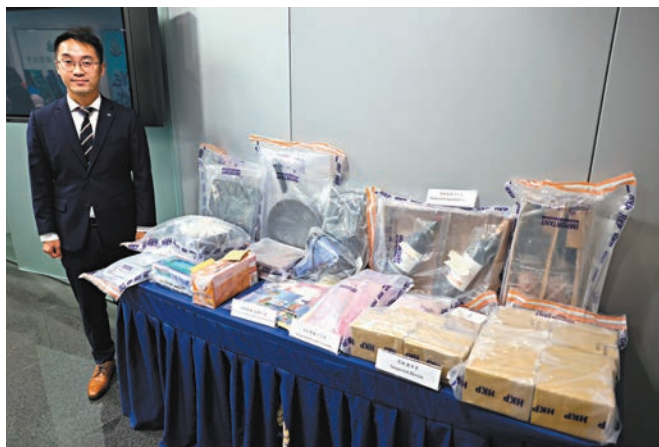
◆警方講述在元朗破獲毒品案詳情及展示檢獲市值1,700萬元毒品等證物。

警方發現除紅酒可卡因外，另一批海洛英裝在零食包裝盒內，不排除被捕男子或同黨，以旅客身份偷運入境或者透過貨運方式寄來香港。是次被捕的男子來自台灣地區，其旅客身份只可在港逗留約一個月，相信販毒集團利用其旅客身份及短暫停留，以「快閃」方式販運及製毒，逃避執法人員追