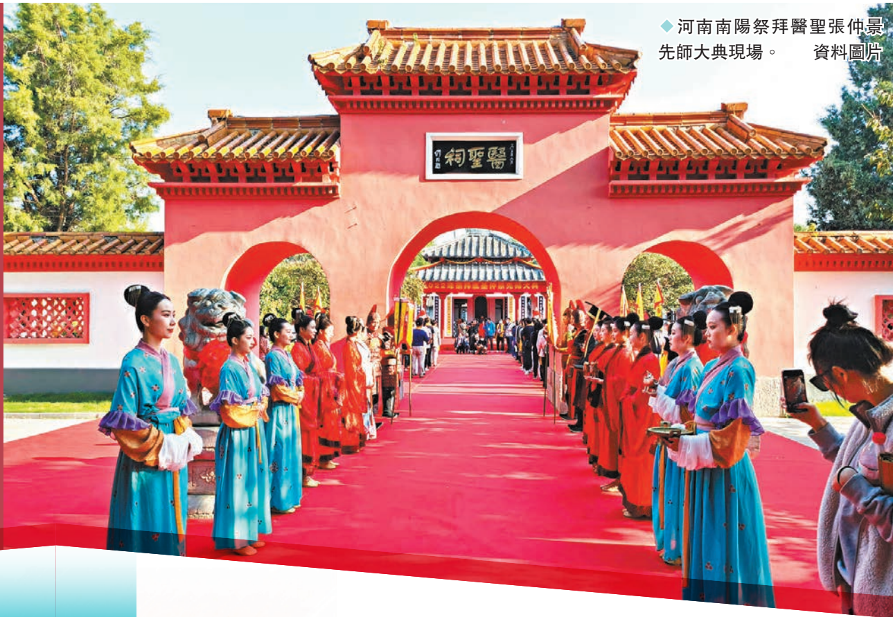
◆河南南陽祭拜醫聖張仲景先師大典現場。