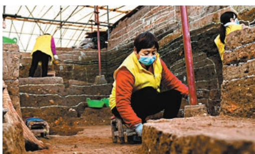
▲2022年12月10日，河南黃山遺址發現6,000多年前糧倉群。 資料圖片