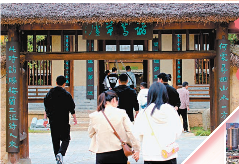
◆河南省南陽市臥龍崗文化園，遊客在諸葛草廬參觀。

「在熱鬧喧嘩的市井中、縱橫交錯的街巷裏，每一條街名都有歷史淵源，每一個牆根都有美麗傳說，每一處宅院都有動人故事。那一條條烙印着南陽人腳印的老街老巷，如一棵大樹的根系，帶着歷史的印跡，見證着南陽城的滄桑變遷。」「謝老二」編輯的文字間充盈着對這座古城的熱愛。