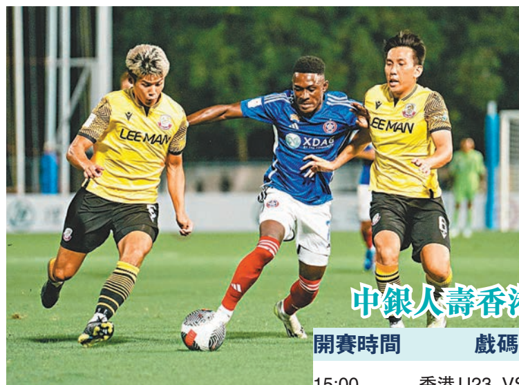
◆兩軍球員在比賽中積極拚搶。

今日將續有三場港超上演，於亞冠盃小組賽再吞敗仗的傑志將於旺角大球場迎戰深水埗，誓要贏出漂亮一仗一洗頹風。另外香港U23及晉峰，則會分別迎戰港會及標準流浪。