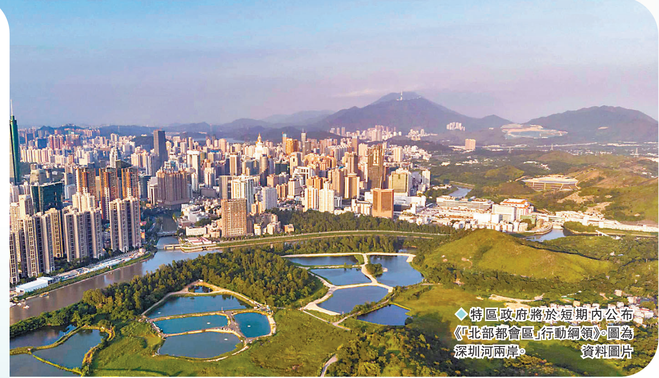
◆特區政府將於短期內公布《「北部都會區」行動綱領》。圖為深圳河兩岸。資料圖片

香港要高速持續發展，必須找準優勢定位。香港特區行政長官李家超日前接受香港大公文匯傳媒集團媒體聯合專訪時指出，香港是「一國兩制」下背靠祖國、聯通世界的國際城市，施政報告鏈接了香港與國家、香港與國際，既有香港觀、亦有大局觀，既有國家觀、亦有國際觀，「這是連成一線的，亦是一脈相承的。」香港最大的機遇就是國家發展機遇，因此施政報告充分利用好香港國際化、專業服務、教育等方面的優勢，融入國家發展大局，並通過「對接北部都會區發展策略專班」合作摸索出最好的融合模式，勾勒出「北部都會區」布局。 ◆香港文匯報記者 劉啟業