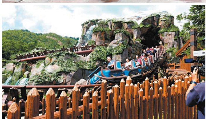
◆大家可乘過山車在森林中穿梭。