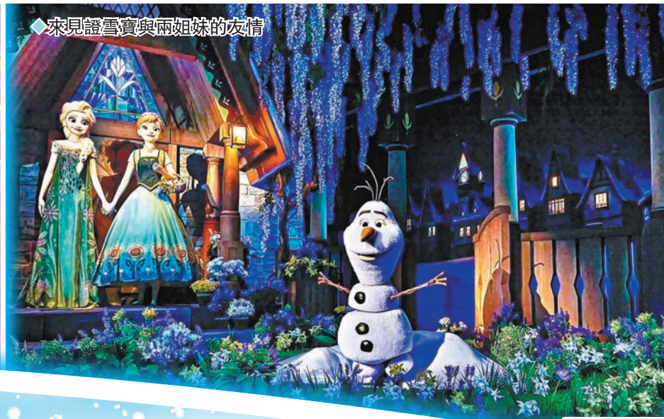
◆來見證雪寶與兩姐妹的友情