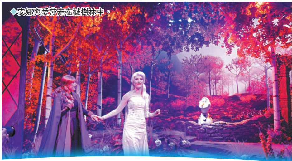
◆安娜與愛莎走在楓樹林中。