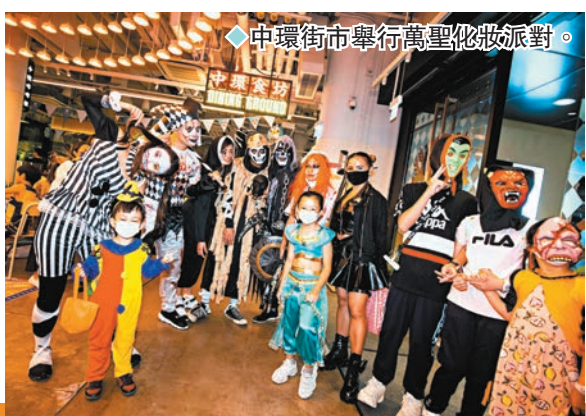
◆中環街市舉行萬聖化妝派對。

適逢全城狂歡的萬聖節即將來臨，中環街市於德國啤酒節中加入萬聖節元素，帶來一連串精彩紛紜的慶祝活動，為一家大細打造一個愉快的聚會場所，讓大小「魔鬼」們都能夠在這個歡樂節日中玩得盡興，營造最有氣氛的節日慶典，齊齊「扮鬼扮馬」共慶雙節。為提振香港夜經濟及響應旅遊發展局的「哈囉威香港」活動，大家在即日起至10月31日期間，到中環街市慶祝萬聖節，早上玩盡一系列精心設計、適合男女老幼的主題活動包括「嘩鬼夜市」及萬聖節兒童舞蹈表演；晚上在啤酒節連串活動中盡興一番，令大小朋友都樂而忘返，享受多項萬聖節節目，配合 Halloween for All 的主題，一齊日與夜玩轉中環街市！