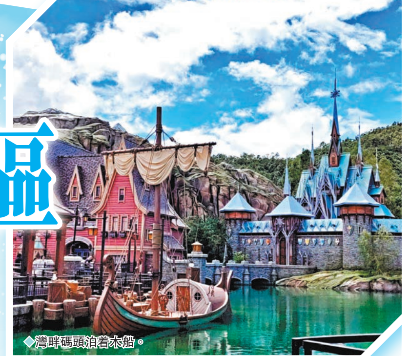
◆灣畔碼頭泊着木船。