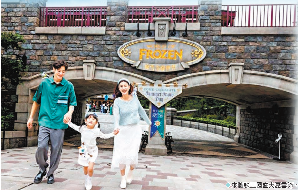
◆來體驗王國盛大夏雪節。