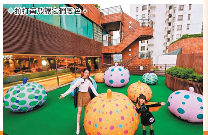
◆拍打南瓜讓它們變色。

萬聖節不一定要「嚇餐飽」才過癮，新城市廣場由即日起至10月31日舉行「Halloween WE WA狂歡派對」，為不同喜好的大小朋友於商場不同角落，準備了充滿玩味和創意的裝飾及活動，與大家共度別具驚喜的萬聖節。近期親子界大熱的 Dino Park 恐龍公園，趁着萬聖節又有新搞作，一隻4米長、換上一身萬聖節色彩服飾的立體恐龍破牆而出，腳踏南瓜與小朋友大玩 Trick or Treat。至於走文青風或 Chill 過萬聖節的話，就不要錯過到7樓仙人掌 x CAMP PARK 與充滿藝術色彩的發光南瓜陣打卡，輕輕拍打南瓜就可瞬間變換色彩，創造專屬的仙氣照片，萬聖節前夕週末及當日更會舉行美食、音樂狂歡派對，大家可邊聽 Busking 邊享受美食及飲品，歡度最 Chill 的萬聖節！ 文：兩文攝(部分)：小樊