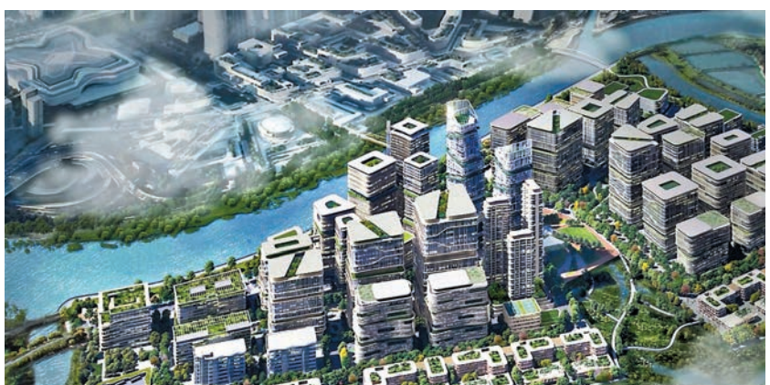
◆港深創科園示意圖

區內流浮山則主要以數碼科技樞紐為產業定位，建立規模龐大數碼港的地標性創科設施，採用數碼科技，推動新經濟與傳統經濟融合，涵蓋金融科技、智能生活和數碼娛樂等，並扶植青年人創業，成為初創企業基地。元朗南則是以房屋為主的社區，共提供超過30,000個住宅單位。政府正就元朗南進行第三期發展規模檢討，預計明年完成。