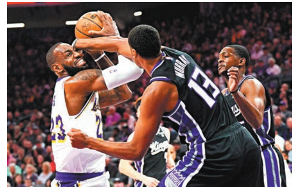
◆勒邦占士(左)傳球受阻。路透社