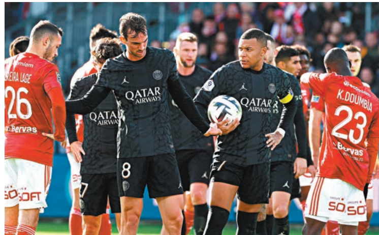
◆比斯特球員與麥巴比(持球者)起口角。

香港文匯報訊(記者 梁志達) 法國甲組足球聯賽當地時間周日的角逐，馬賽主場對里昂一戰由於客隊大巴在途中遇襲比賽而要延期；而麥巴比則在巴黎聖日耳門(PSG)作客戰勝比斯特3：2比賽中，因為慶祝入球的動作而觸怒了比斯特球員和球迷。