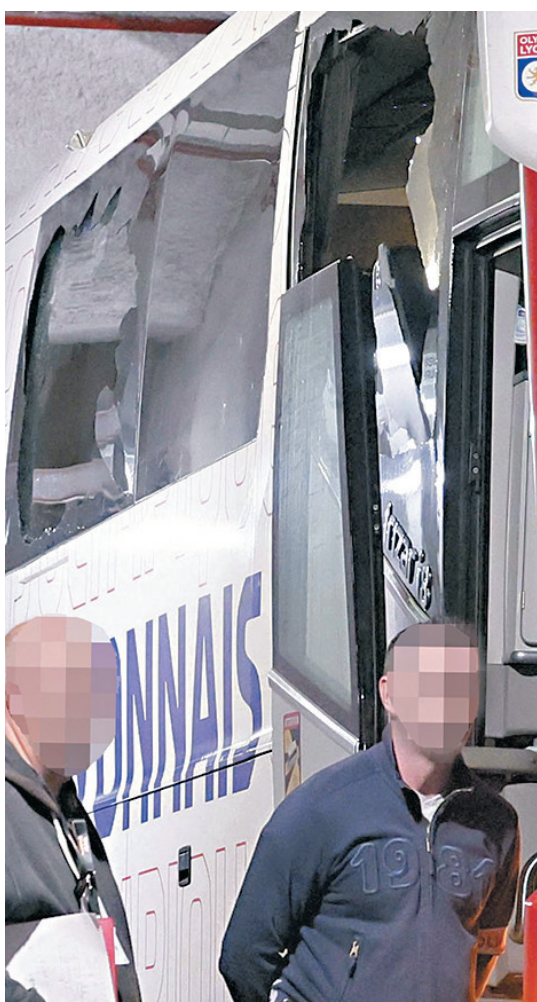
◆里昂隊乘坐的大巴車窗被擊碎。