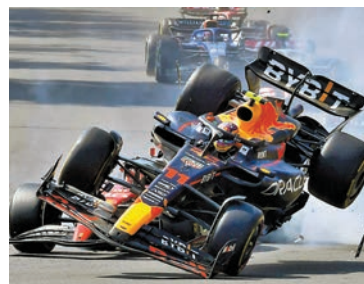
◆佩雷斯起步不久便要退賽。

香港文匯報訊(記者 梁志達) 在主場享受熱情支持的紅牛車手佩雷斯，昨天在一級方程式(F1)墨西哥站中，與法拉利車隊的勒克萊和他紅牛隊友世界冠軍韋斯達賓並肩挑戰領先位置時，與勒克萊的戰車發生碰撞，最終無奈退賽。他表示，主場出賽卻在進入第一個彎便撞車的事故，成了自己F1生涯其中一個「最傷心的經歷」。韋斯達賓結果在此站奪冠，贏得本賽季第16個分站冠軍，以491分領先240分的佩雷斯排第1。