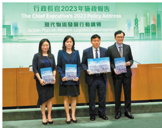
◆運輸及物流局局長林世雄(右二)等官員昨日舉行記者會，發布《現代物流發展行動綱領》。

行動綱領又提出，政府已在「北部都會區」的洪水橋/厦村新發展區，預留約37公頃土地發展現代物流圈。林世雄表示，物流涉及運輸、加工、裝卸等多個環節，不同物流產品亦有不同需要，這些工序不需要集中在同一個位置進行，因此物流圈設施會分布在「北部都會區」的不同位置，不同地方會有不同物流圈，例如近口岸位置會集中跨境運輸，認為這對物流業的長遠及持續化發展有幫助；他續指圈內亦不只有物流活動，會有其他