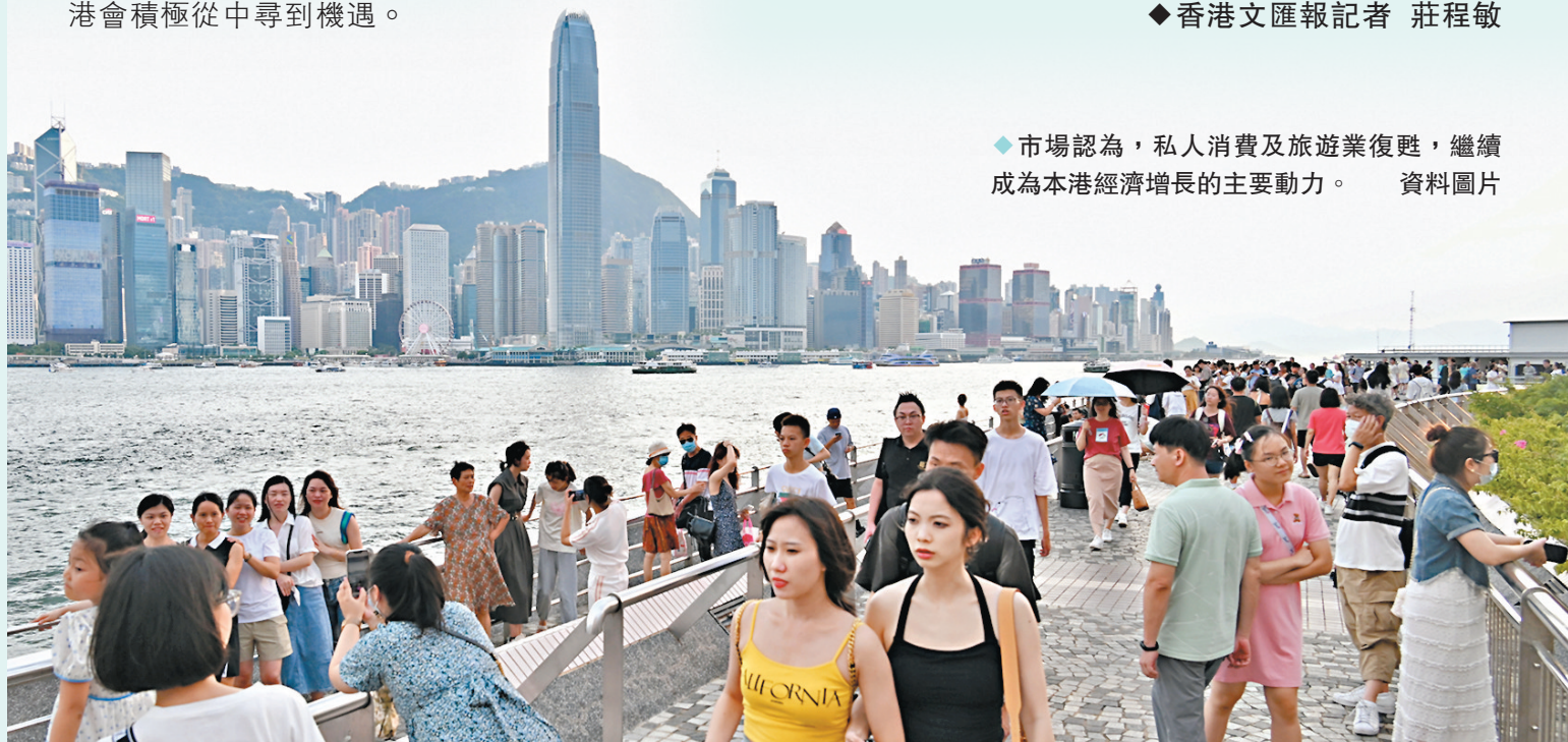
◆市場認為,私人消費及旅遊業復甦,繼續成為本港經濟增長的主要動力。

預估數字顯示,本港今年第三季經濟持續擴張,主要是由於內部需求及服務貿易均進一步改善,在住戶收入上升及政府多項措施支持下,私人消費開支上升6.5%,惟升幅較第二季的7.7%放緩。政府消費開支第三季實質下跌4.5%,第二季的跌幅為9.8%。整體投資開支在去年低比較基数下強勁反彈,第三季本地固定資本形成總額由跌轉升18.2%,第二季則下跌0.5%。受惠於訪港旅客人數繼續上升,服務輸出升24%,高於第二季的22.8%升幅。由於對貨物的外部需求疲弱,整體貨物出口繼續下跌,第三季貨品出口總額按年跌8.6%,較第二季15.1%的跌幅收窄;貨品進口按年跌6%,第二季跌15.8%。第三季本地生產總值的修訂數字和及全年修訂預測,將在11月10日公布。