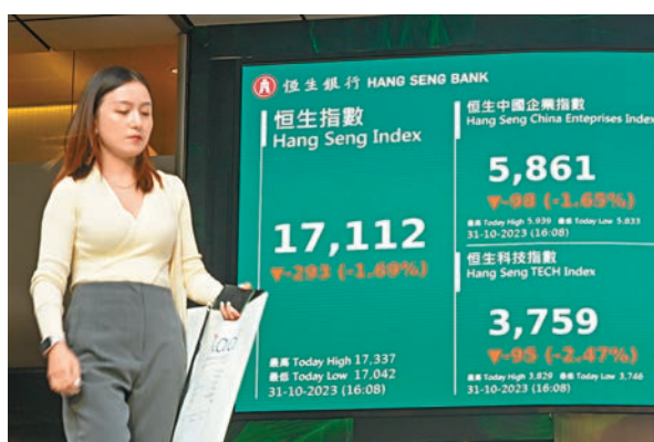
◆港股昨一度挫364點,險守萬七關,成交縮減至846億元。 中新社

香港文匯報訊(記者 周紹基、章蘿蘭)隔晚美股造好,但內地10月份PMI數據再度轉弱,且表現遜市場預期,拖累港股及A股在10月最後一個交易日向下。其中,恒指最多跌過364點,低見17,042點,全日跌293點或1.7%,收報17,112點,成交縮減至846億元。雖然市場經常認為10月為「股災月」,惟恒指10月僅累跌697點或3.9%,跌幅並不算大,市場人士希望,中美元首會面後,將改善投資氣氛。另外,聯儲局議息在即,投資者也觀望美國息口及美債走勢。