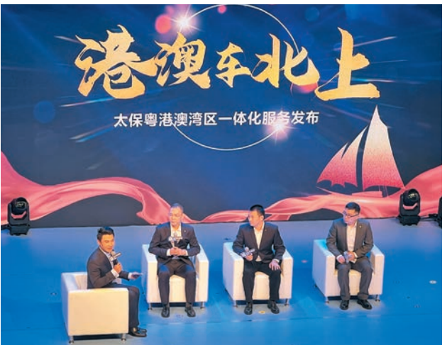
◆中國太保昨日舉行大灣區客戶節發布會。

另外，中國太保產險營運華南中心副總經理袁亞利表示，為了保障港澳客戶在內地出險，太保還推出「六項特色服務」，分別是專屬服務、現場在身邊服務、在線快易免服務、人傷全程愛服務、困境助救援服務、法律援助服務。其中，「現場在身邊」服務，就是港澳客戶出險後，通過網絡化智能調度模式分派案件至就近查勘員，快速到達現場提供專業服務。另外，如果客戶比較着急不想在現場等待，還有在線快易免服務，港澳客戶可選擇線上快速簡易查勘服務，免除等待時間。