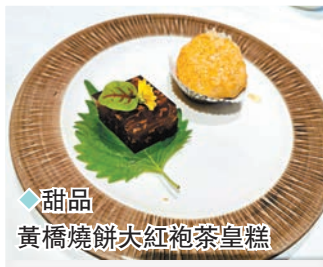
◆甜品 黃橋燒餅大紅袍茶皇糕

香港食客一聽到黯然銷魂飯就明白講的是什麼。就是廣東著名的燒味又燒飯，而且是有質素的又燒才配稱銷魂吧，灣仔區著名的六國飯店近日推出的「黯然銷魂飯套餐」非常受熟客歡迎。套餐推廣期至2024年1月31日，所以筆者特別去睇睇呢個黯然銷魂飯套餐的吸引之處，套餐有靚湯、正菜加甜品，更免費茶芥及小食費，抵呀。