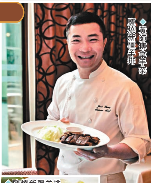
◆鹽燒新疆羊排不能錯過。