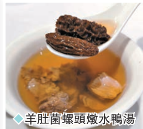
◆羊肚菌螺頭燉水鴨