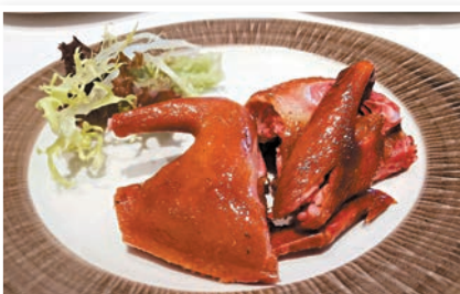
◆煙燻鴿比炸乳鴿高一層次，煙燻後鴿呈微微紅色。

套餐的主角「黯然銷魂飯」出場，一隻荷苞蛋下藏着兩塊厚切又燒，一條青菜，看上去沒甚特別，食完才知其過人之處，一咬咬下去又燒是香口又鬆化的梅頭肉，肉汁調味又是高人一籌，一食就知大廚功力。加埋煎蛋，脆邊內是流汁蛋黃；將雞蛋搗碎，蛋汁全數流入純泰國青靈芝香米內，加入燒豬油撈勻，豬油香氣四溢，呢款黯然銷魂飯真是無敵。最得值得一提是豉油汁都好講究，是用上香港頤和園御品精裝醬油，所以「黯然銷魂飯」真是名不虛傳。其實食完前面的幾道菜後「黯然銷魂飯」的分量肯定女士吃不完。飯後甜品「黃橋燒餅大紅袍茶皇糕」的燒餅外脆內軟，微甜，口感豐富，後者的茶皇糕，入口即嘗到大紅袍的茶香，充滿茶味，是坊間小有的甜品。