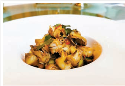
◆「椒香汁花螺」的椒香汁絕對是這冷盤前菜的靈魂所在