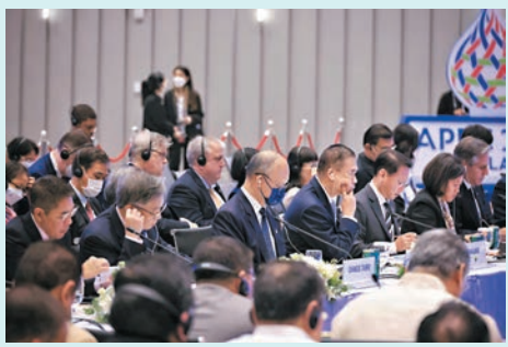
◆ 行政長官李家超因日程原因，將委派財政司司長代為出席本月於美國舉行的APEC領導人非正式會議。圖為早前APEC部長級會議。

據悉，李家超已答應出席將於本月16日由本地及國際商會聯合舉辦的午餐會，會上將闡述新一份施政報告的重點，及談到勞動市場、土地房屋供應、環境等議題，以及分享如何與內地緊密融合、讓青年參與香港發展等。