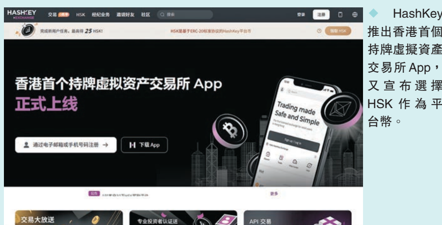
HashKey推出香港首個持牌虛擬資產交易所App，又宣布選擇HSK作為平台幣。

持牌虛擬資產交易所HashKey昨宣布，獲證監會批准開放移動端完整交易功能，推出香港首個持牌虛擬資產交易所App，又宣布選擇HSK作為平台幣，今後投資者可透過HashKey的App直接買賣虛擬貨幣。此外，另一間虛擬資產交易所和Web3技術公司OKX宣布，虛擬銀行ZA Bank已為OKX香港開立營運賬戶。ZA Bank的營運賬戶將會為OKX香港，提供基本的商業銀行服務，以滿足其日常銀行理財需要。 ●香港文匯報記者 周紹基