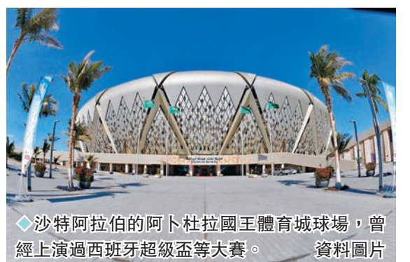
◆沙特阿拉伯的阿卜杜拉國王體育城球場，曾經上演過西班牙超級盃等大賽。資料圖片

此前，國際足協曾宣布，2030年世界盃唯一的舉辦申請由摩洛哥、葡萄牙和西班牙三國足協聯合遞交，目前這三個國家已確認申辦意願。由於2030年將舉行世界盃百年慶典，國際足協計劃在烏拉圭、阿根廷和巴拉圭分別舉行一場世界盃比賽，這三個國家也已向國際足協確認了舉辦意願。沙特與摩洛哥、葡萄牙和西班牙三國一樣，還需要通過國際足協的審核。如果這幾個申辦國家都能夠滿足國際足協提出的要求，走完全部申辦流程並通過，那麼國際足協將在2024年年底的國際足協大會上確定其舉辦權。