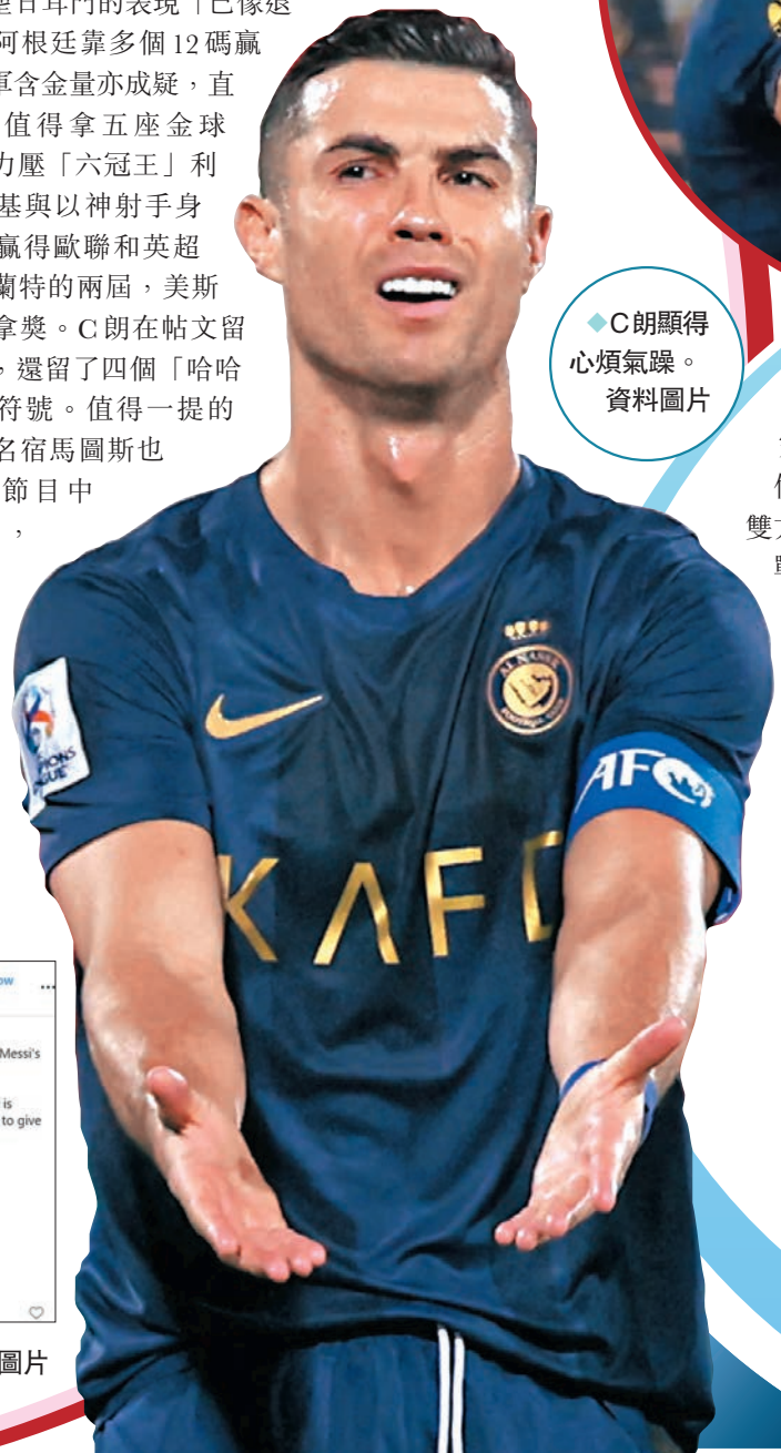
◆C朗顯得心煩氣躁。資料圖片

香港文匯報訊（記者 梁志達）今場沙特國王盃其實也充滿火藥味，完場後更引發雙方球員衝突，兩隊名將佐敦軒達臣和拿模迪也牽涉其中。伊蒂法克球員艾哈沙領紅牌完場前被逐，球證鳴笛後，雙方球員似乎餘怒未了，伊隊另一位球員佐敦軒達臣加入戰團，這位前利物浦隊長用肩膊撞跌奧達維奧，後者隊友拿模迪不忿上前和軒達臣理論，雙方初起口角之後互有推撞動作，要由其他隊友隔開，後來部分兩軍隊員圍着互有爭拗，好在事件未有再升級。C朗在疑似責備軒達臣後並肩一起步離球場，之後C朗又做出手勢似乎是在抱怨什麼。