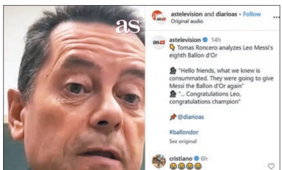
◆C朗對朗些路的評論影片段讚好。網上圖片