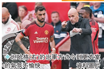
◆坦哈格(右)的治軍方式令到更衣室的氣氛不愉快。資料圖片