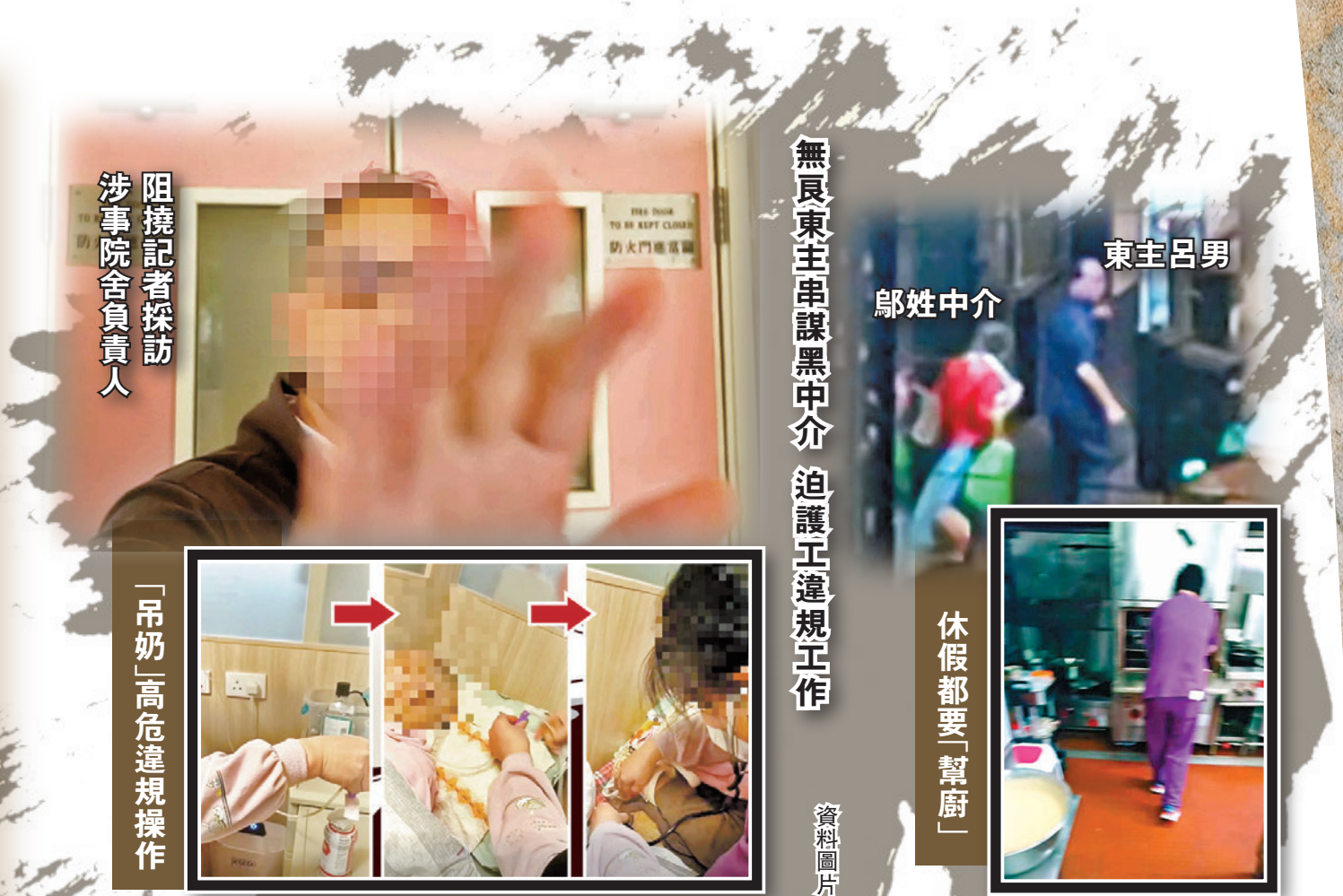
阻撓記者採訪 涉事院舍負責人