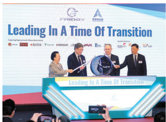
◆ 第三屆「國際傳播高端論壇」開幕禮。

很強，但缺乏道德和感情，由於未來在法院、醫院、自動駕駛等都會用到人工智能，也依然要由人來進行最後把關，因此必須討論在適用人工智能的道德問題。