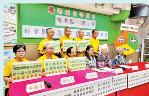
◆ 明愛長者聯會調查顯示，逾六成受訪長者在身體狀況許可下，希望留在香港居家安老。

「我住天水圍，有一次要去荃灣看醫生，沒能預約陪診服務，好在有個好心人和我同路，我才順利到達，但回程時又搭錯車。」她認為對於體弱長者而言，陪診、清潔和送