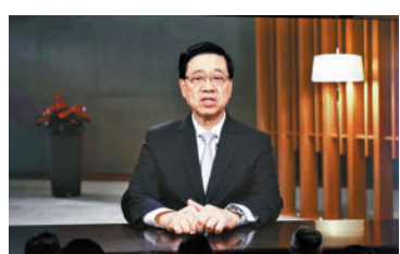
◆ 李家超視像致辭。

在以「新時代 新商機」為主題的論壇中，多名嘉賓表示，世界目前的「變遷」有三個，分別是地緣政治變遷、科技變遷，以及環境變遷，令整個世界變得極具顛覆性。邁向可持續發展的世界，就必須放眼世界，通力合作，利用專業的知識，創造互惠、有包容、有道德的世界，把握好有利於全球的發展方向。 在以「人工智能之機遇、管治與道德規範」為主題的論壇上，有嘉賓認為，人工智能的邏輯性